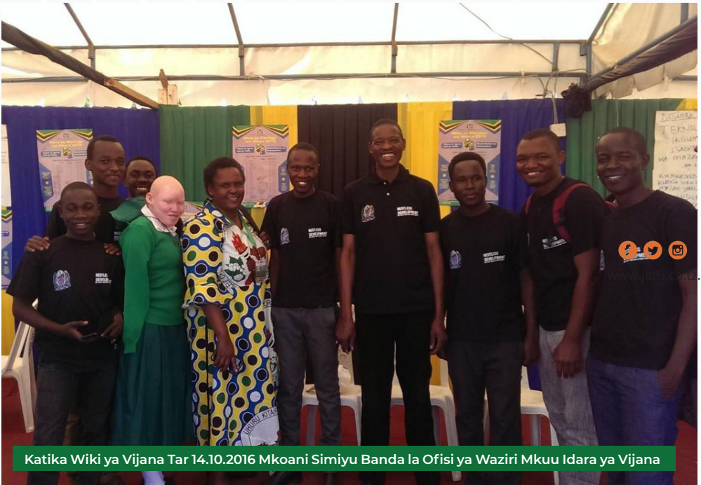
Katika Wiki ya Vijana Tar 14.10.2016 Mkoani Simiyu Banda la Ofisi ya Waziri Mkuu Idara ya Vijana

JATU ni zao la vijana wabunifu waliotelewa na ofisi ya waziri mkuu baada ya wazo la JATU kushiriki katika maonesho ya wiki ya vijana mkoani Simiyu kwa udhamini wa ofisi ya waziri mkuu, Idara ya vijana mwaka 2016. Katika shindano hili ambalo lilikua limelenga kuibua vijana wenye mawazo ya ubunifu nchini Tanzania, JATU ilifanikiwa kuwa kumi bora kwa mwaka 2016 na tangu hapo ofisi ya waziri mkuu wamekua walezi wa kudumu wa kampuni hii na hata kuiunganisha JATU na wizara ya kilimo ambayo kupitia mkakati wa sera ya vijana wameiwezesha JATU kushiriki vyema katika miradi ya kilimo na viwanda nchini Tanzania.