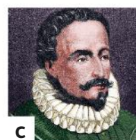
c Miguel de Cervantes