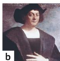
b Cristóbal Colón