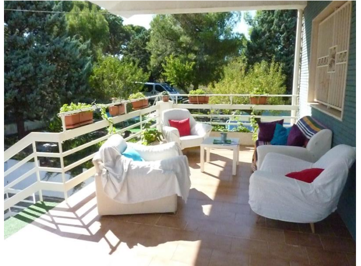
Villa alma en Italie