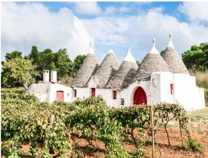
Village de Trulli