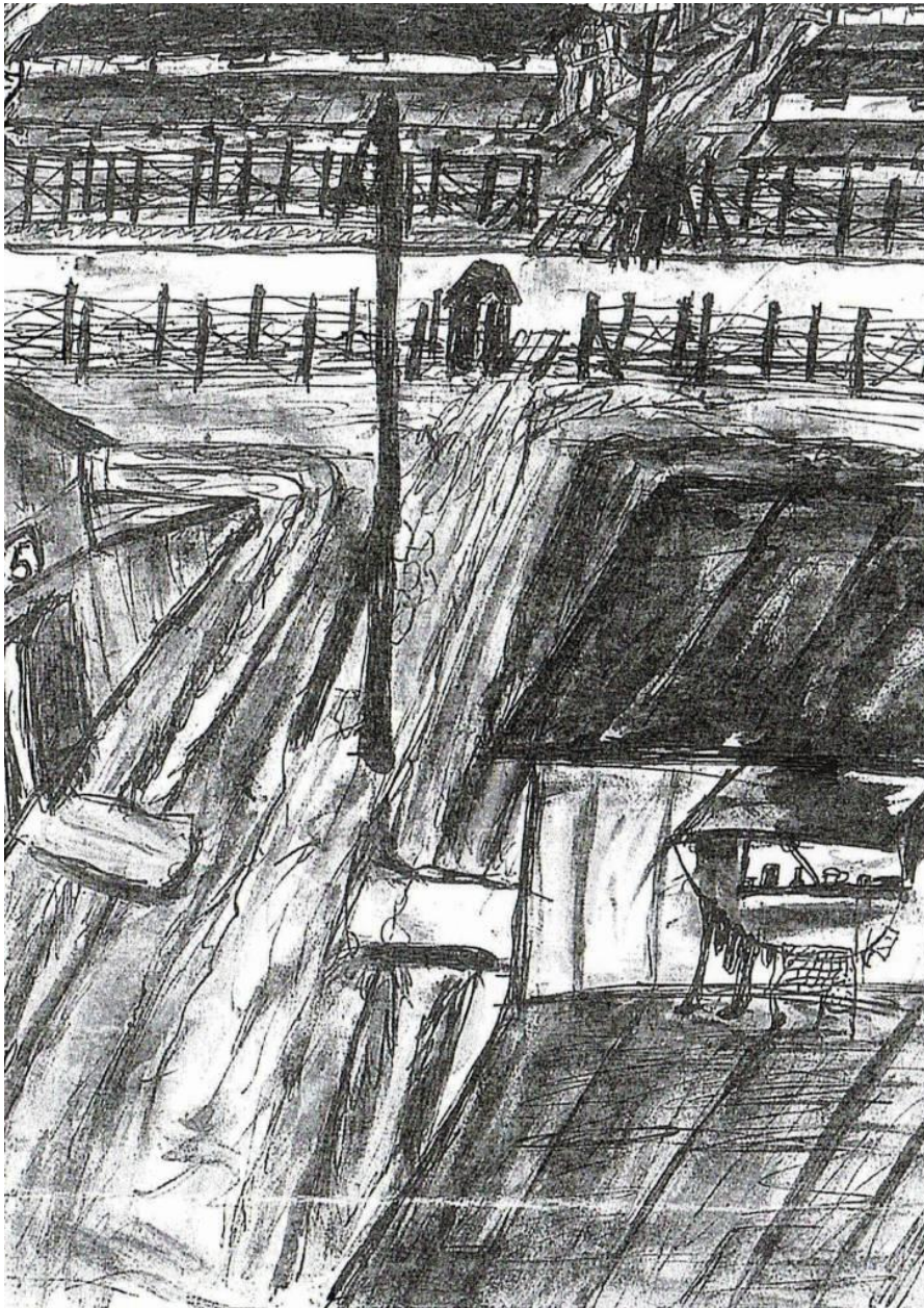
Le camp. Dessin d'Hella Tarnow