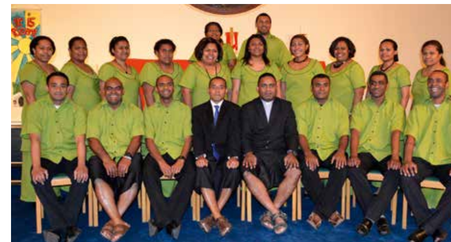
Na matasere ni Gütersloh/Bielefeld ena katokatonu ni matasere e Jamani, na Lako Yani Vou, 2014.

Mai yaco tale na nodra veidigitaki na lewe ni lotu ka sa