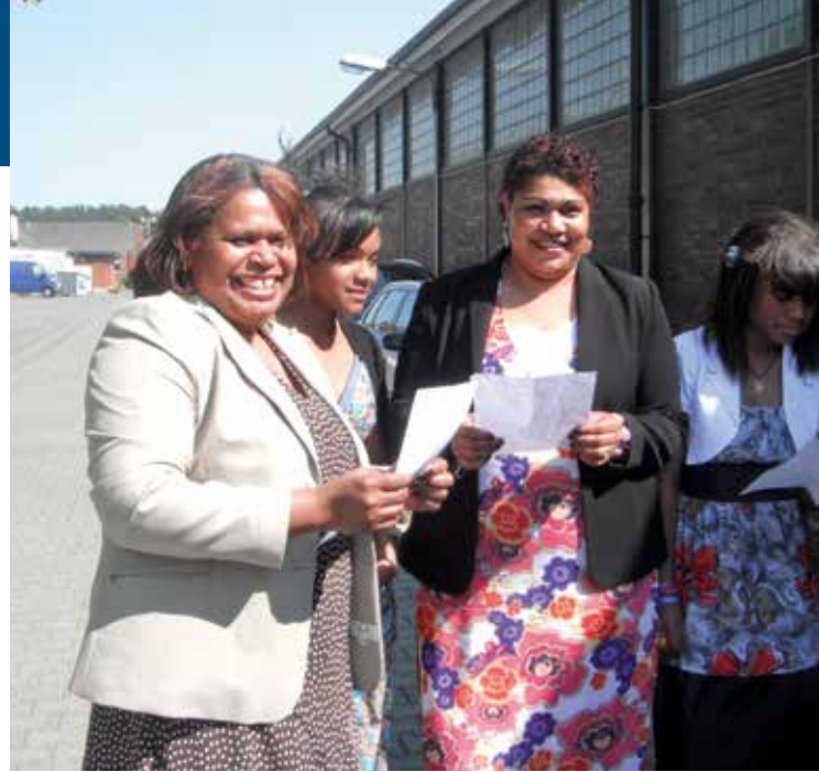
Radini Qase vakacegu - Vani Vunimoko

Tauyavutaki ni Lotu e JHQ ena i ka 5 ni Me 2009. A tekivutaki na