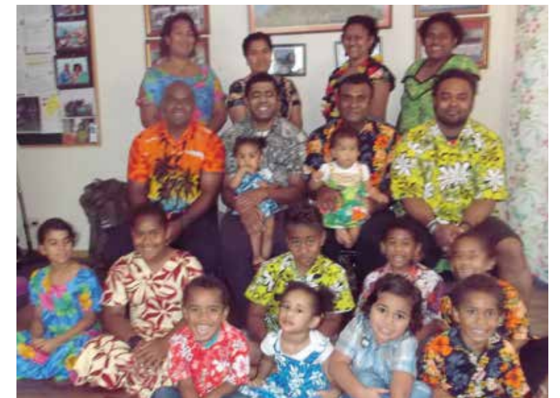
Matasiga naba 1