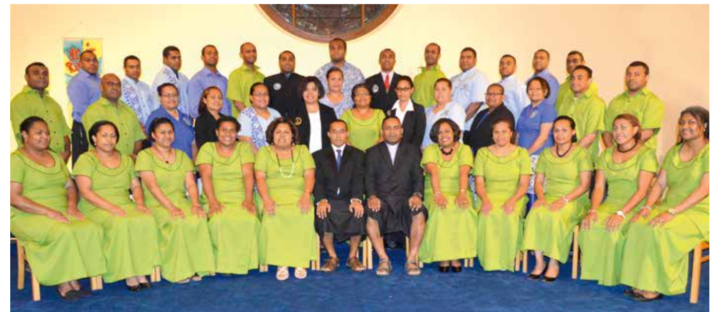
Lako Yani Vou Choir, 2014