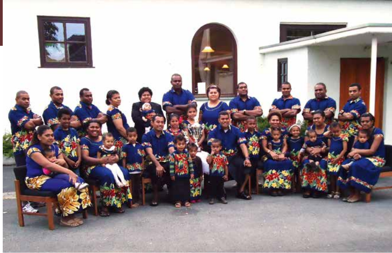
Vavakoso e Paderborn, Sennelager, 2011