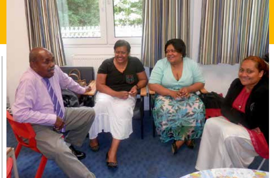
Vulagi mai Naisogowaluvu, 2014

Me vaka ni keimami bula tu vakamataivalu e vuqa e ra lesi ena vei ya rua kina tolu