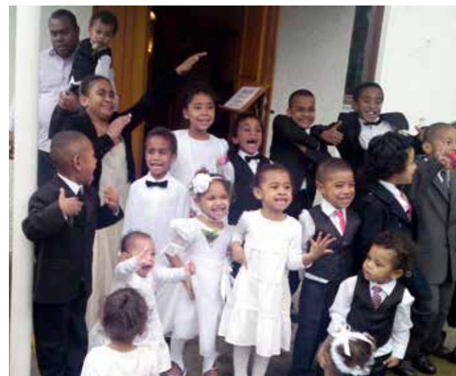
Sigatabu ni Gone e Dempsey Barracks, Sennelager, 2010

It has been an enormous pleasure to serve (in Paderborn since 2010) as a Chaplain and Church of England priest alongside friends from the Fijian Methodist Church, sharing the use of the Church in Dempsey Barracks, Sennelager.