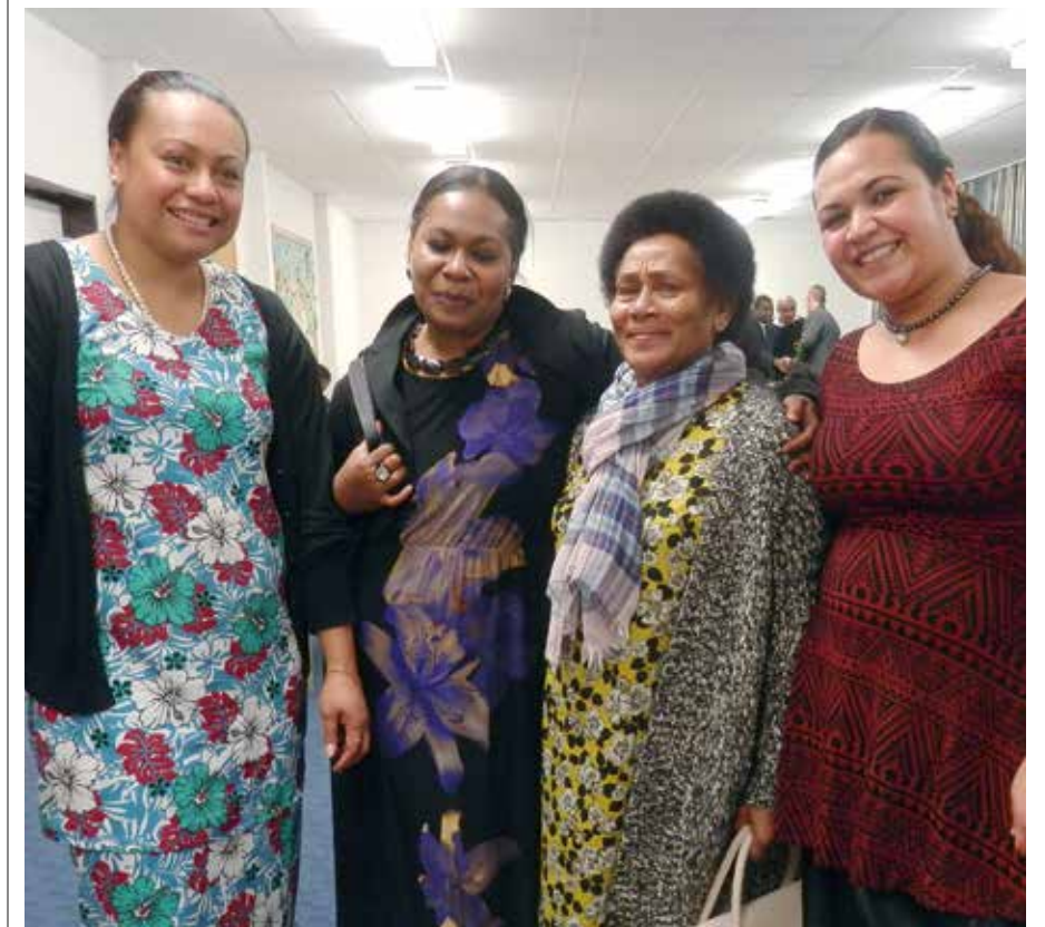
Veiqaravi ni suka na lotu ni vakavinavinaka e Fallingbostel, 2014