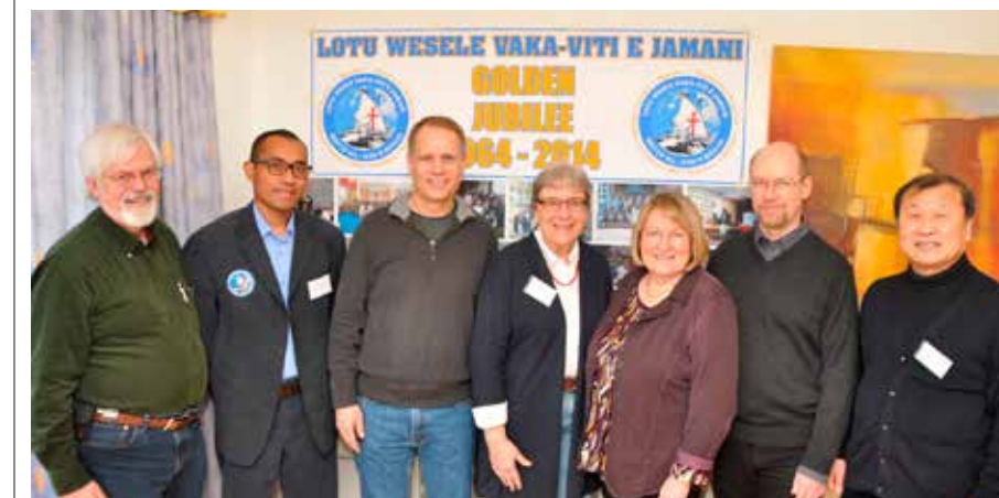
European Methodist Migrant Ministries Leadership Seminar