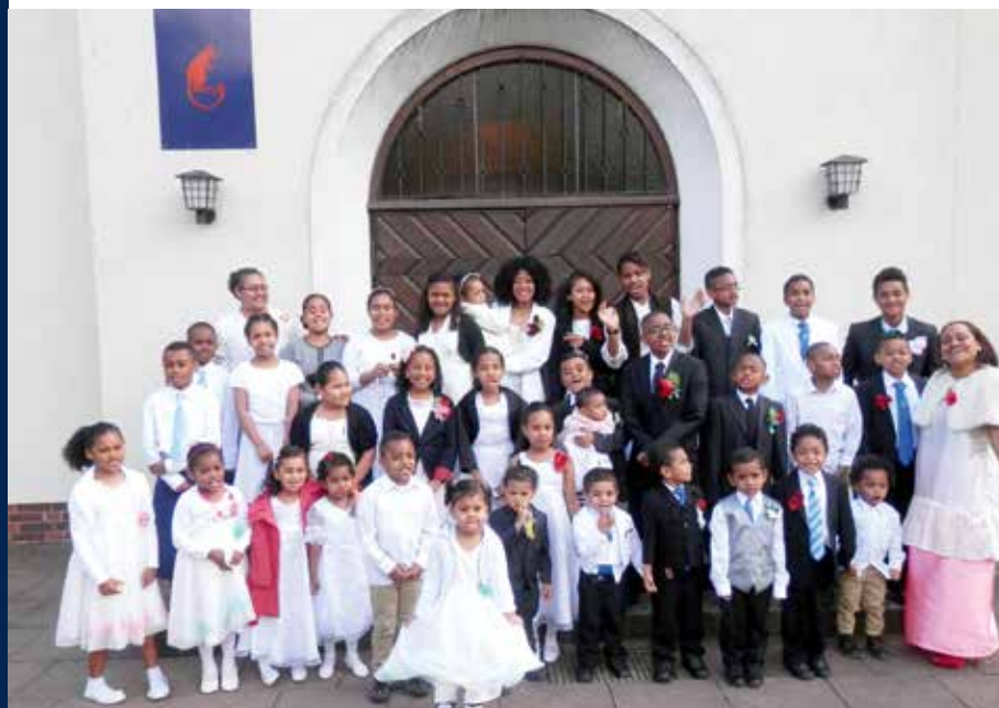
Matawili vola ni sigatabu e Fallingbostel/Hohne, 2014