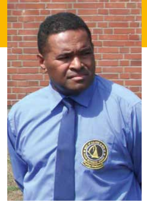
Saiasi Vasu Qase vakacegu Fallingbostel/Hohne

Ena yabaki oqo, 2014 sa mai veisau na veiliutaki ni lotu e Fallingbostel, ni sa mai cava na cakacaka vakamataivalu vei ira na veiliutaki makawa.