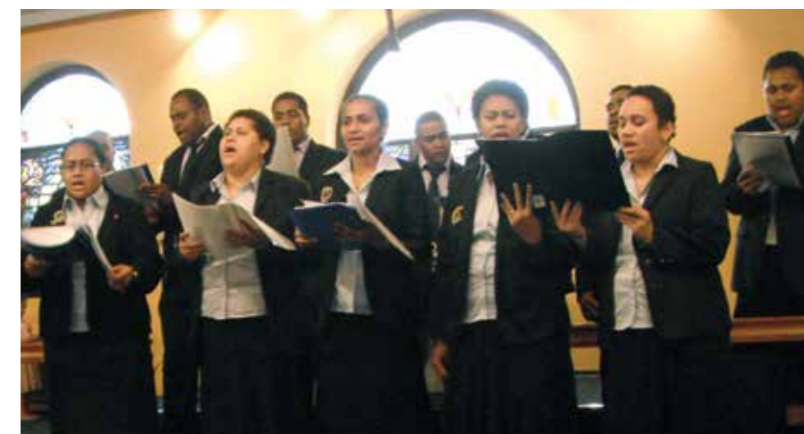
Matasere ni Paderborn ena Lotu Cokovata 2012