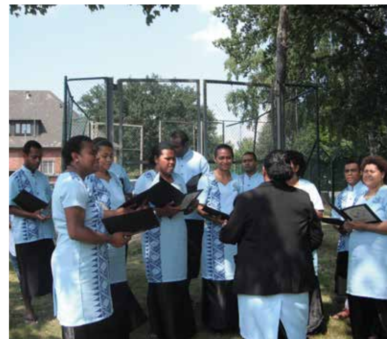
Ena Lotu Cokovata e Gütersloh, 2013

Na matata kei na dei ni Lotu e Paderborn, e sa i vakaraitaki vinaka ni kena cuqeni na soqoni vaka matasiga.