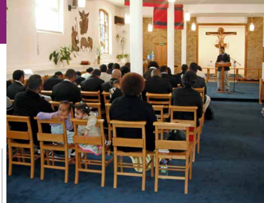
Lotu vata e Hameln,

Toso tiko mai na yabaki 2011 kina 2013 era lewe vuqa tale na vuvale era sa gole tale mai Hameln me ra