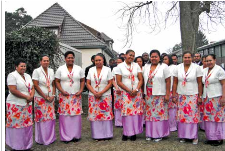
Ira na marama lewe ni matasiga ni Gütersloh/Bielefeld, 2011