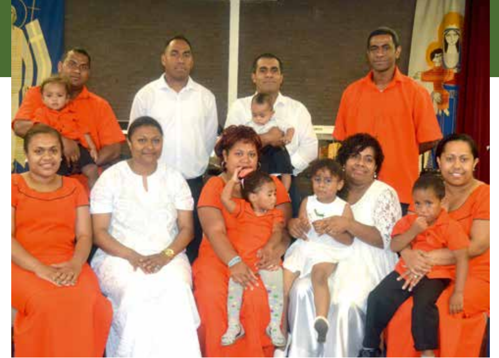
Matasiga naba 5

• Me vakauqeti o ira nai tubutubu me ra papataisotaki na i solisoli ko se bera tu nira papoitaistaki.