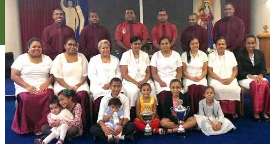
Matasiga naba 2

Etuwate Cagilaba. Cavutu mai Yanuca, Moturiki, Lomaiviti. Vasu ki Vacaleya,