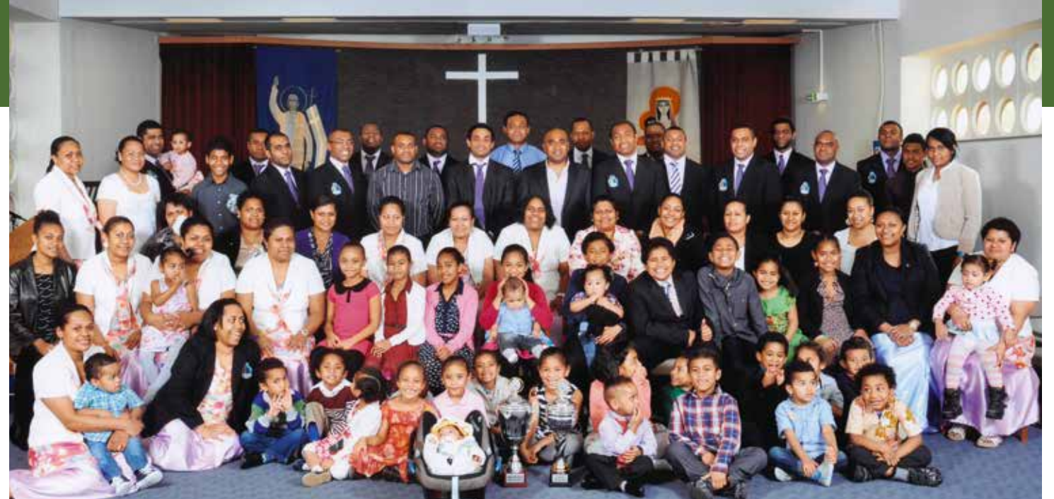
Na vale ni Lotu e Gütersloh kei Bielefeld, 2013