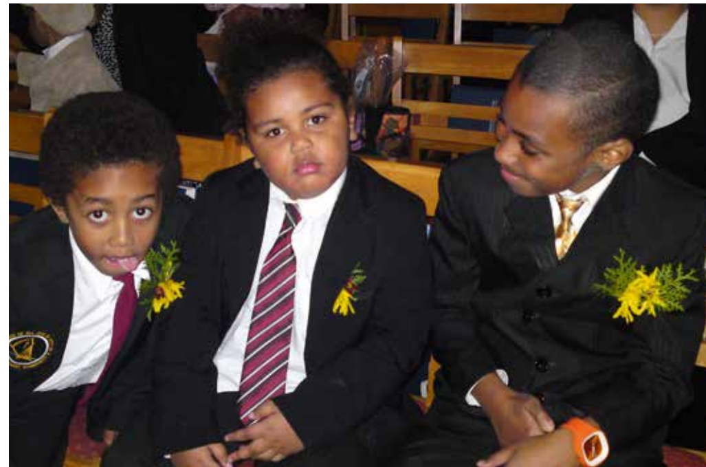
Sigatabu ni Gone, 2011