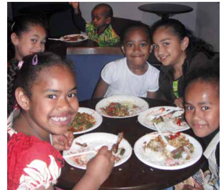
Ira na i solisoli ena sogoti ni Macawa ni Veivakalotutaki, 2011