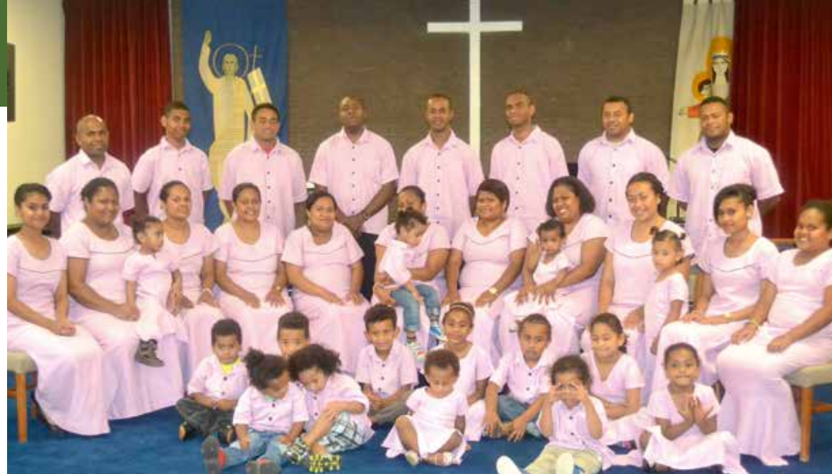
Matasiga naba 4

Siga Dina - 13 Siga Tuberi - 20 Siga Veitokani - 4 Levu kece - 37