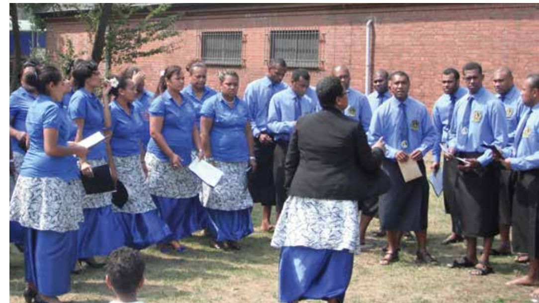
Vakarau na laga sere ena Lotu Cokovata e Gütersloh, 2013