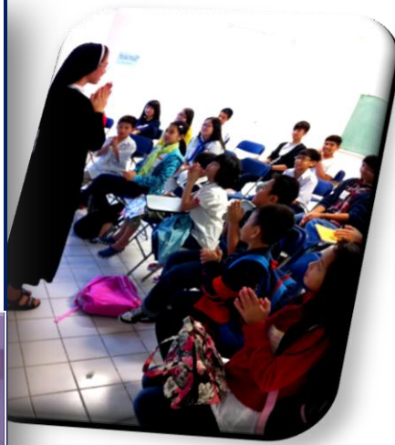
December 15, 2012- Vocation Talk at LaVang Mission Church (Kindergarden to 11th grade students). We sang, we danced, we talked, we discussed and we shared the joy of our vocation with the students.