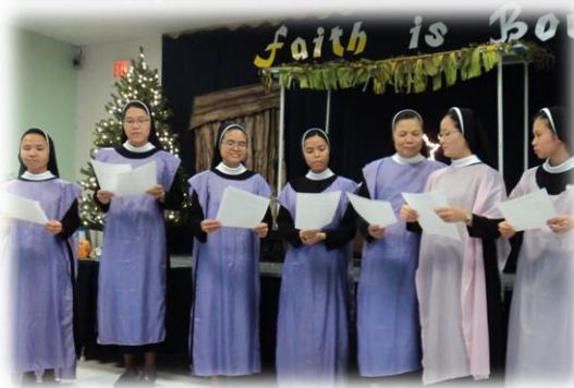
December 25, 2012- The sisters gathered for our Christmas celebration with appreciation, gifts, food, songs, dance, skits and joy as we celebrate Jesus' Birthday. Merry Christmas to us and to all of you!