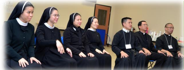
Vocation Panel to answer questions about religious life at TSC 31st National Convention.