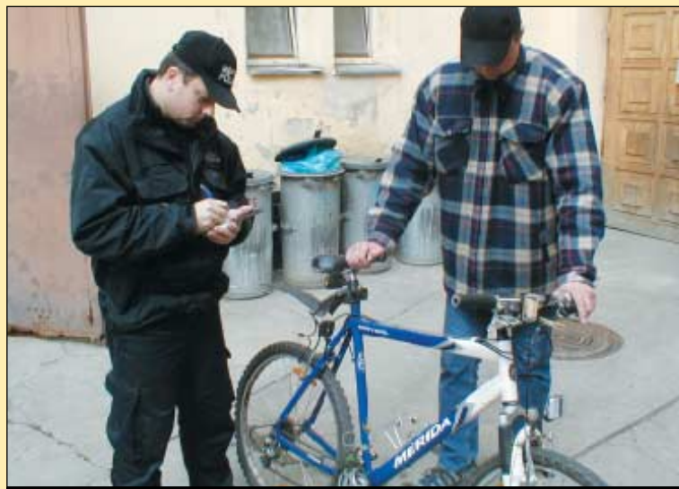
V současnosti strážníci vedou v evidenci 156 kol