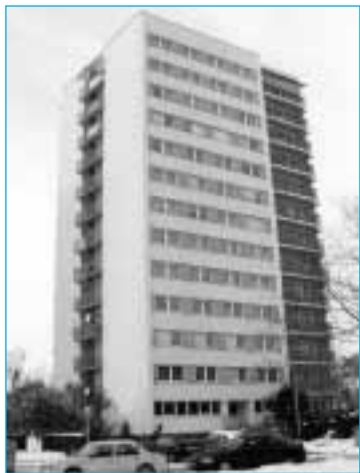
1. místo v kategorii Panelový dům získala budova v ul. Sokolská 3

Na vítězném objektu v kategorii novostavba, rodinném domu, Přerov VIII – Henčlov, Zakladatelů 77/46 porota ocenila komplexní řešení fasády i jednotlivé detaily, například malované číslo domu na fasádě. Kladně vyhodnotila i vhodně kombinované řešení obkladů s barvou fasády, prvky odpovídající současné době, odůvodnila Olga Krčmová.