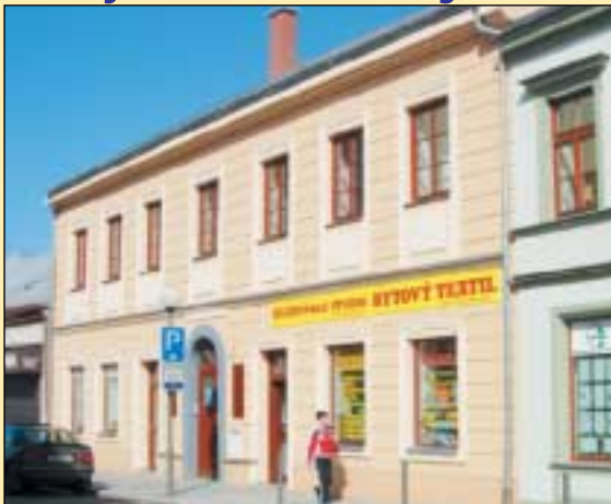
1. místo v kategorii rekonstrukce získala budova sídla firmy RPIC-Ekonomservis, Blahoslavova 72/4

„Soutěžní porota na vítězné fasádě v kategorii rekonstrukce, kterou je sídlo firmy RPIC-Ekonomservis, nej-