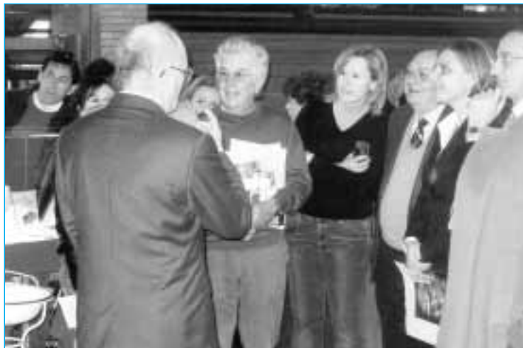
Záběr z vernisáže výstavy slabikářů v Neapoli

Toto moderní muzeum bylo po úpravách umístěno v obrovském továrním komplexu na pobřeží Neapole mezi Coroglio a Bagnoli.