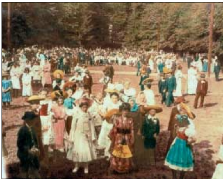
Pohled na dětskou slavnost v centrální části háje Michalov, po roce 1892

lo více než 1 900 diváků. Značný zájem tehdy zaznamenal i film Měsíc nad řekou promítaný v Michalově. Mezi úspěšné akce patřil i táborák na břehu Bečvy , kde se v kulturním programu představil řecký soubor Belojanis. Během května probíhaly též sportovní soutěže. Dne 8. května se konal Velký karneval , kterého se zúčastnilo asi 1 100 mládežníků. Znač-