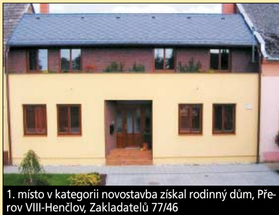
1. místo v kategorii novostavba získal rodinný dům, Přerov VIII-Henčlov, Zakladatelů 77/46

U vítězného objektu v kategorii panelový dům v Sokolské ulici 3 přispělo k vítězství kromě kvalitně provedených stavebních prací také citlivý přístup k barevnému řešení, komplexní řešení celého průčelí, včetně sladění balkonů, sjednocení všech prvků na fasádě, žaluzií, zastřešení horních balkonů. pokračování na straně 2