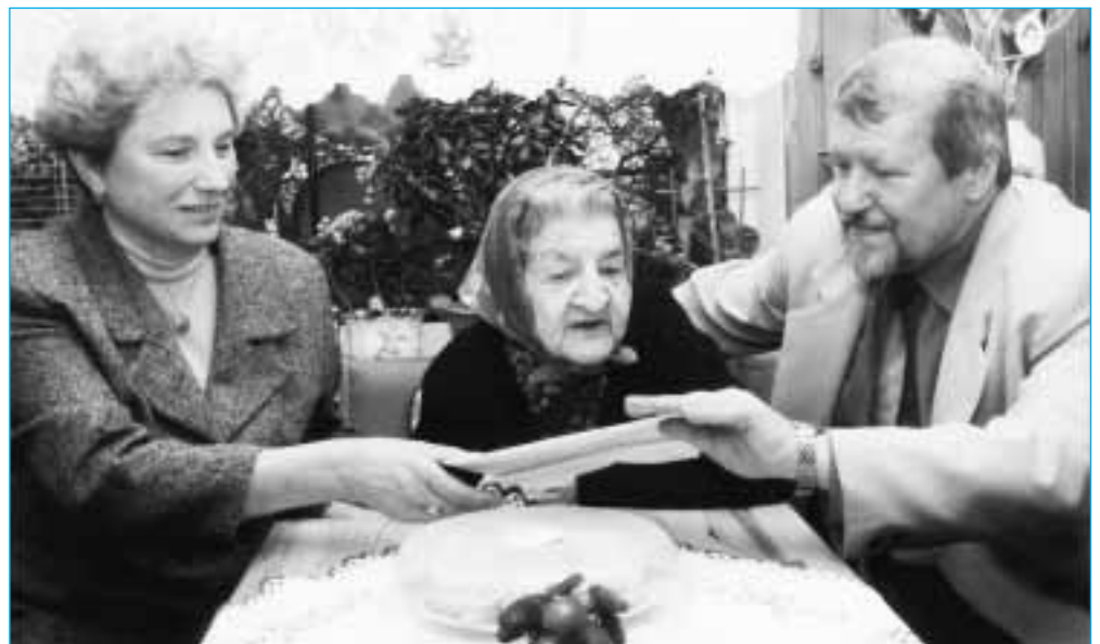
Oslavenkyně na snímku uprostřed