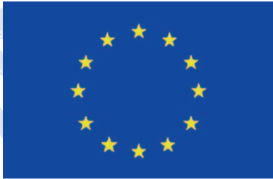
A Bandeira Europeia

A bandeira europeia é composta por 12 estrelas douradas, colocadas em forma de círculo sobre um fundo azul, e representa a união dos povos da Europa .