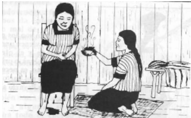
Tomado de DMIECH, 1989

Las autoridades de salud de nuestro país y del resto de Centroamérica comienzan a percatarse de la importancia de la medicina popular tradicional en las comunidades para la solución de diferentes problemas de salud.