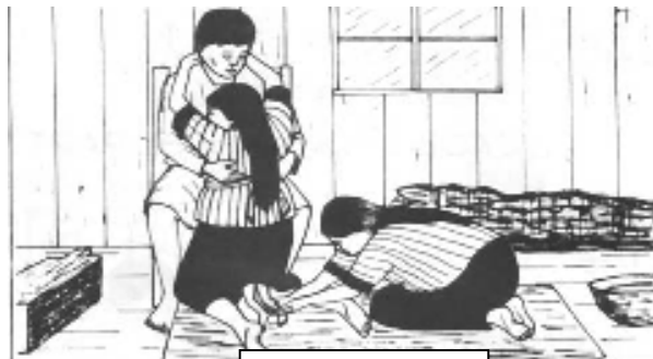
Tomado de OMIIECH, 1989

El Convenio 169 es un espacio de negociación y que su contenido refleja el estado actual de los avances sobre el reconocimiento de derechos indígenas. Sin duda este instrumento jurídico internacional no refleja las máximas aspiraciones de las poblaciones indígenas pero de hecho es un avance para la consolidación de las mismas.