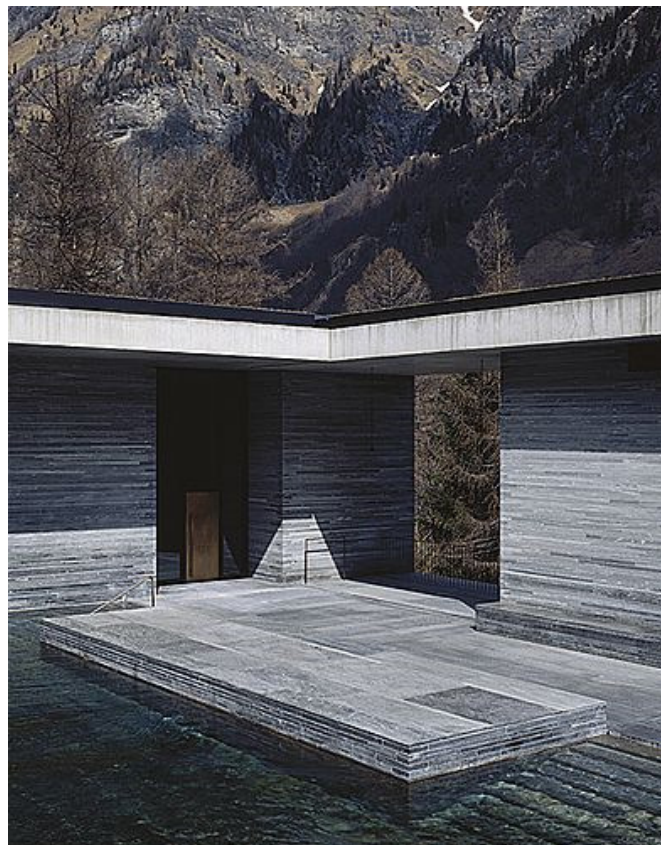
Abb: 4 >

T.H.: Das ist ein sehr schönes Schlusswort. Ich danke Ihnen sehr für das Gespräch und würde mich freuen, Sie einmal in Basel am NFS Bildkritik «eikones» begrüßen zu können.