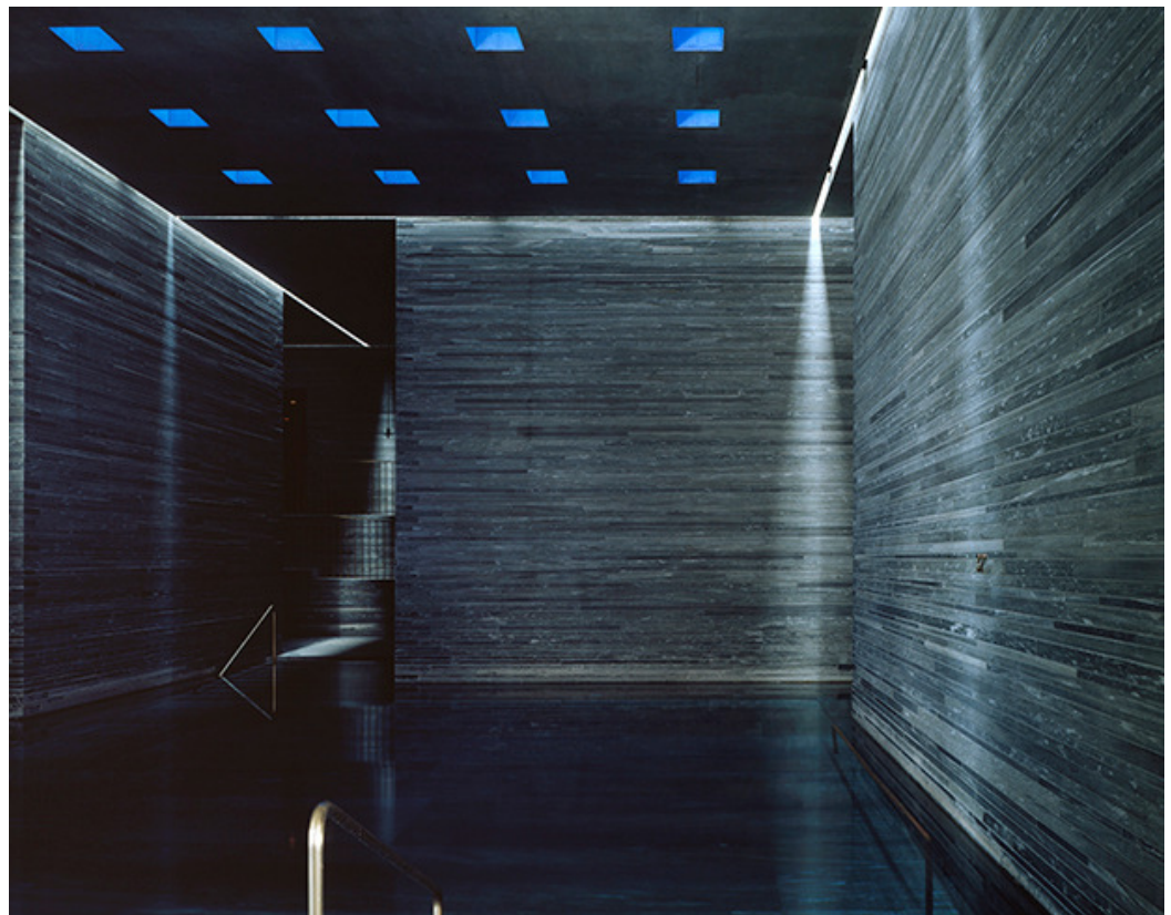
Abb: 2 >

Deswegen muss ich auch etwas Neues schaffen. Wenn ich kopiere, wenn das Bild importiert ist, dann stimmt für mich etwas nicht. Aber ich verarbeite viele Bilder. Manche haben in der Therme Vals ein orientalisches Bad gesehen. Es heisst dann nicht, es sei «bilderlos». Es hat dann eher die gleiche «Atmosphäre, wie...» Es ist nicht in den Formen gleich, aber das Gebäude in Vals weiss, dass es türkische Bäder gibt.