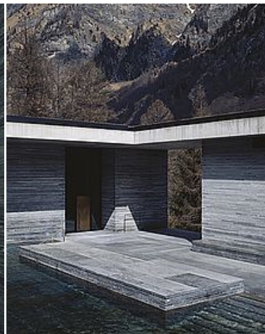
Abb: 4 >