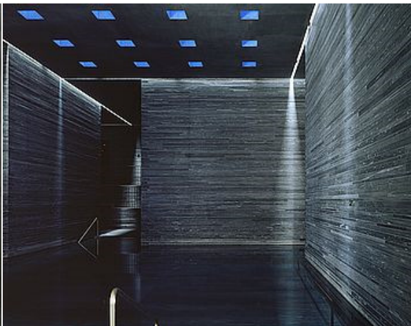
Abb: 2 >