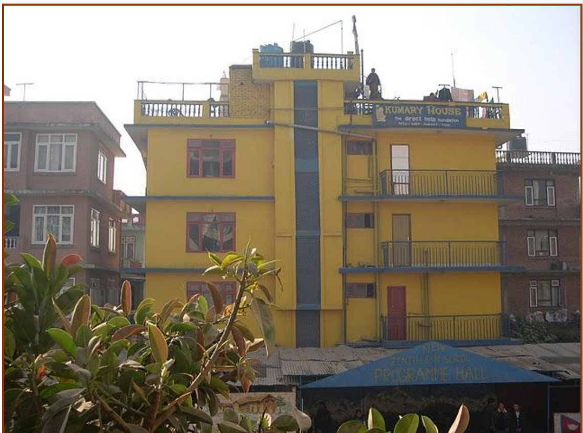
Kumari House (Katmandú / Nepal)