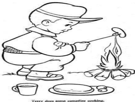
Terry does some campfire cooking.