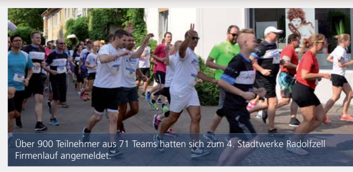
Über 900 Teilnehmer aus 71 Teams hatten sich zum 4. Stadtwerke Radolfzell Firmenlauf angemeldet.