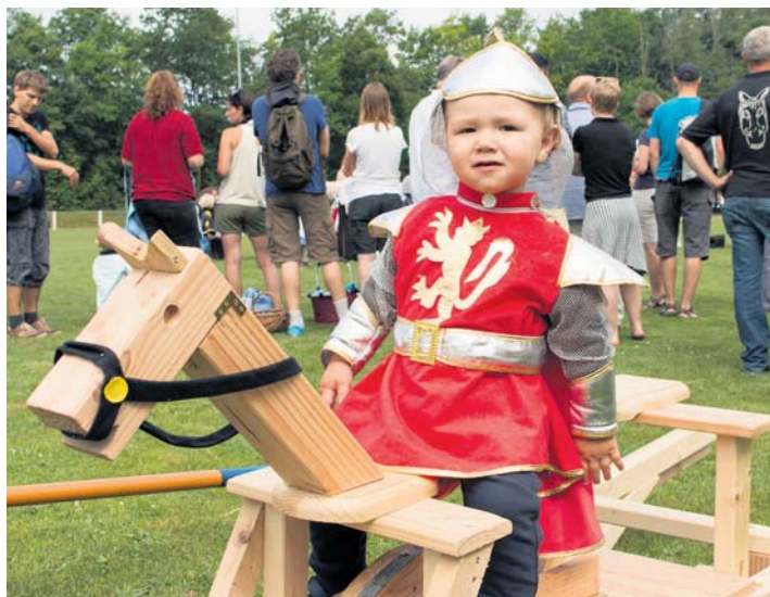
Hoch zu Ross zeigte sich dieser kleine Ritter beim Mittelaltertreiben unter der »Schwedenschanze«.