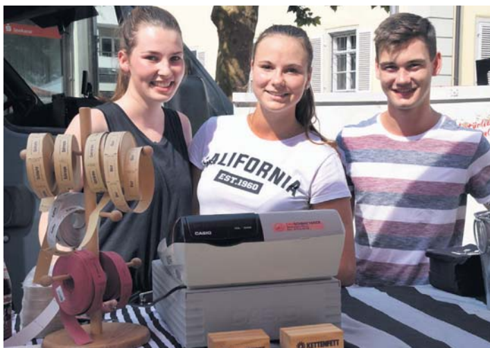
Über 40 Beschicker sind ein neuer Rekord bei den Radolfzeller Abendmärkten, die am vergangenen Donnerstag offiziell eröffnet wurden.

Mit einem neuen Rekord an Besuchern wurden die Abendmärkte am vergangenen Donnerstag offiziell eröffnet. Auch in diesem Jahr lädt das abendliche Markttreiben wieder bis zum 7. September - das sind 12 Mal in Folge - jeden Donnerstag von 16 bis 21 Uhr auf den Marktplatz ein. »Die Abendmärkte sind zu einer Erfolgsgeschichte für Radolfzell gewor-