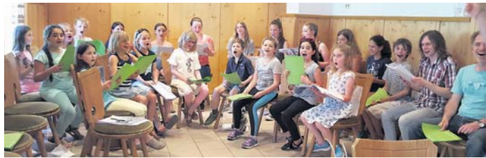
Fleißig geprobt hat die Jugendkantorei für das Musical »Hoffungsland« am 1. Juli.