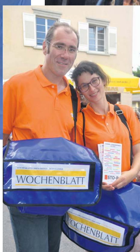
Starkes Extrablatt! Der Einkaufsführer 2017 des WOCHENBLATTs wurde auf dem Straßenfest am Samstag des »Schweizer Feiertags« verteilt.