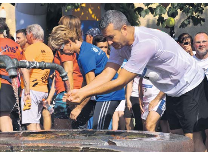
Nach getaner Arbeit war eine Erfrischung angesagt: Dieser Teilnehmer des SWR-Firmenlaufes freute sich nach dem Zieleinlauf über eine kalte Dusche.

► Noch mehr Fotos unter: wochenblatt.net/bilder