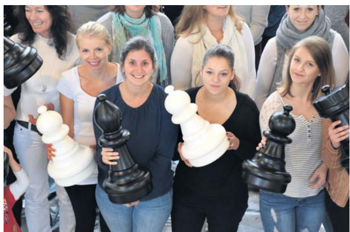
Die Mitwirkenden beim Lebensschachspiel in Möggingen scharren schon mit den Hufen - und zwar nicht nur die Springer.

Ihr Wochenblatt-Redakteur Matthias Güntert