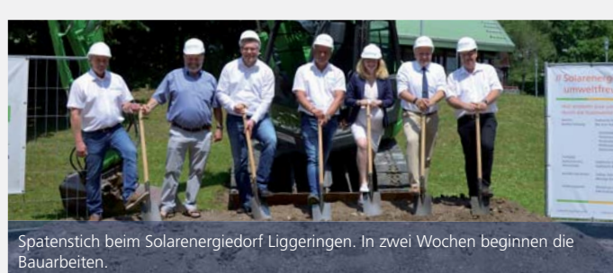
Spatenstich beim Solarenergiedorf Liggeringen. In zwei Wochen beginnen die Bauarbeiten.