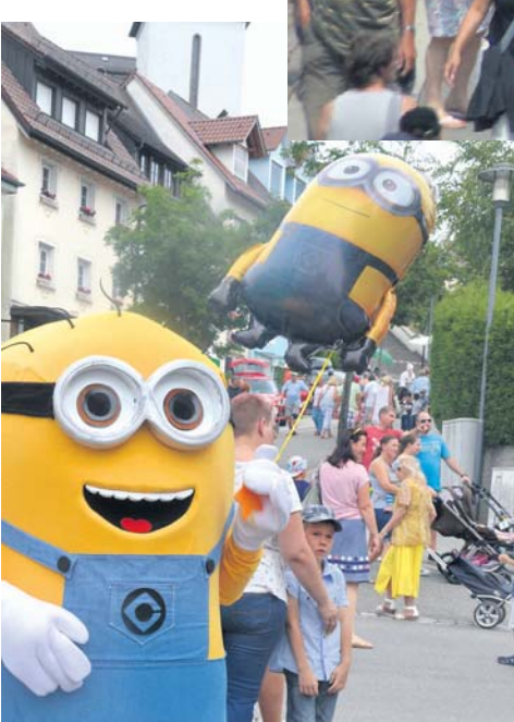
(oben) Über 200 Teilnehmende gestalteten das Straßenfest am Samstag als einen unverzichtbaren Klassiker des »Schweizer Feiertags«. Es hatte auch echte »Größe«.