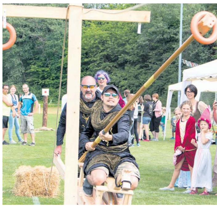
Sichtlich Spaß hatten die Teilnehmer des »Spiel ohne Grenzen« am vergangenen Wochenende in Güttingen.

sorgte der Kindergarten für altersgerechte mittelalterliche Spiele.