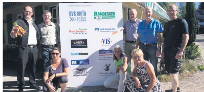
Der Schienerberglauf wird am 1. Juli wieder zahlreiche Läufercracks aus der Region nach Schienen locken. Startschuss für den Hauptlauf ist um 15 Uhr. Wie die Organisatoren erklären, wird es während des Laufes auf dem Festplatz wieder allerlei Leckereien aus dem Gasthaus »Hirschen« geben. Es gibt knackig frischen Salat, hausgemachte Bratwürste und Ochsenfetzen. Die Schiener Frauen sorgen für ein leckeres, vielfältiges Kuchensortiment.