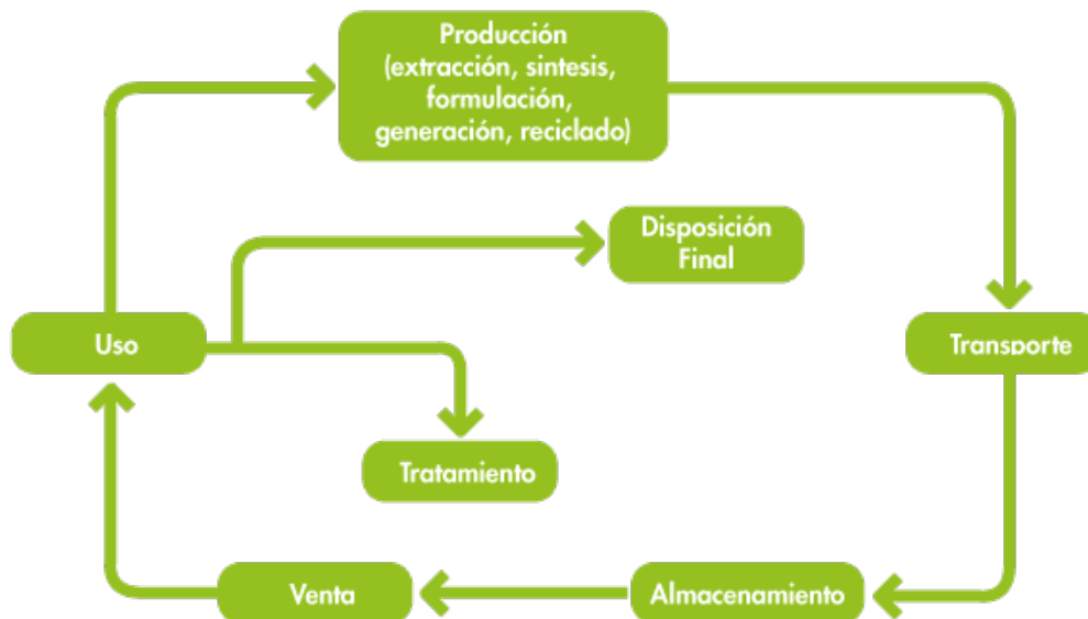
Figura 1. Diagrama de generación de Residuos Peligrosos.

Los Residuos Peligrosos se generan al final del ciclo de vida de los materiales peligrosos, es decir, se generan al desechar productos de consumo que contienen materiales peligrosos, al eliminar envases contaminados con ellos; al desperdiciar materiales peligrosos que se usan como insumos de procesos productivos (industriales, comerciales o de servicios) o al generar subproductos o desechos peligrosos no deseados en esos procesos.