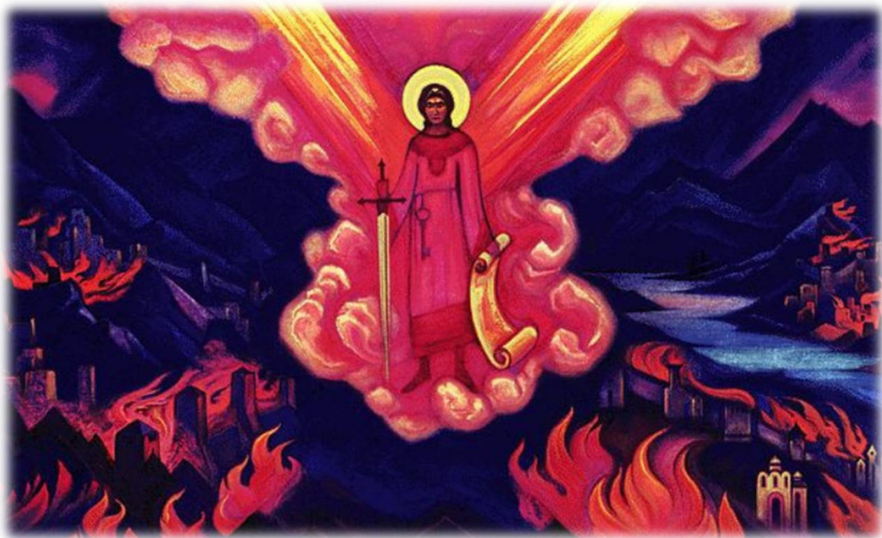
N. ROERICH L'ULTIMO ANGELO

Poi vidi un altro Angelo potente che scendeva dal cielo, avvolto in una nuvola; sopra il suo capo era l'arcobaleno; la sua faccia era venire il sole, e i suoi piedi venire colonne di fuoco; In mano teneva un libretto aperto. ... Sette tuoni emisero le loro voci ... [e] io stavo per scrivere ... [ma] sentii una voce dal cielo dire dentro di me: Sigilla le cose che i sette tuoni hanno detto, e non le scrivere (Ap. X, 1-4).