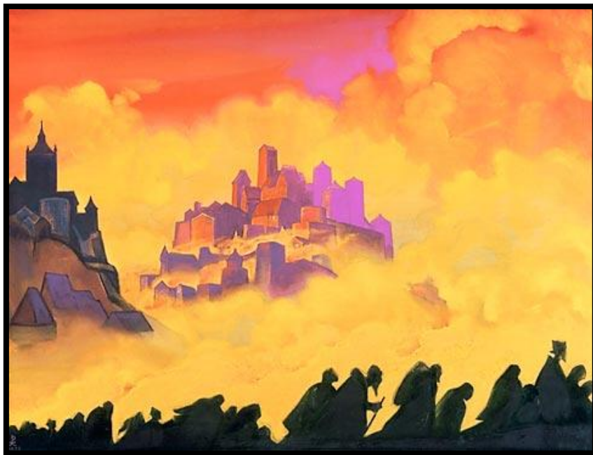
N. ROERICH – ARMAGEDDON