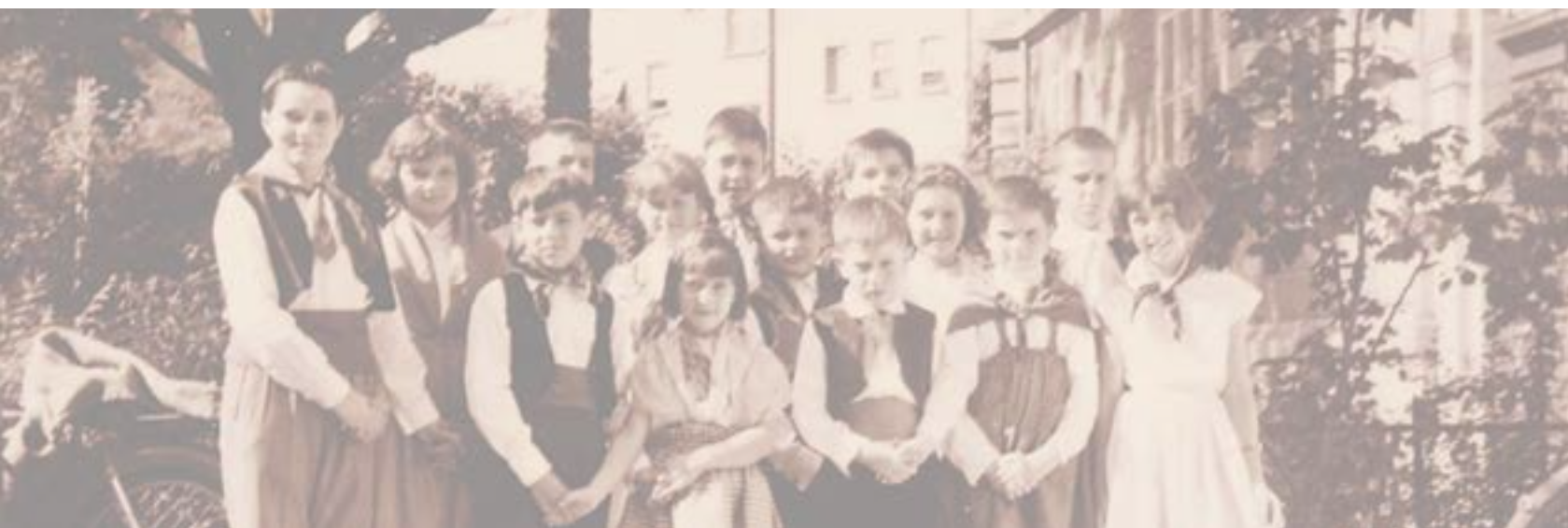
Notre première classe en 1956

Le 1er février 2018 , le LFZ est élu « construction suisse de l'année 2017 ». Les effectifs passent le cap des 1.000 élèves.