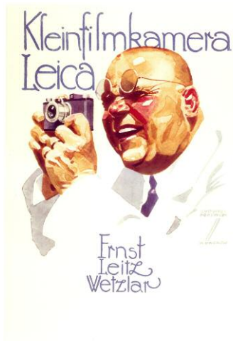
21. Leica Anzeigenmotiv von Ludwig Hohlwein, 1926 (erschieden in »Die Reklame«, Berlin 1926).