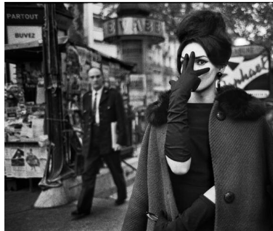
10. Christer Strömholm. Nana, Place Blanche, Paris 1961.