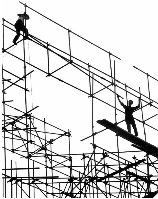
19. Hans Silvester: Stahlgerüstmontage, ca. Ende der 1950er Jahre. Silbergelatine, Vintage Print.