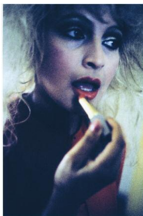
11. Jeffrey Silverthorne: Rosa with lipstick, Tex Mex, 1986