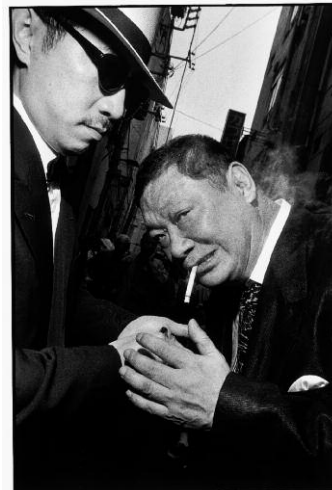
18. Bruce Gilden: ohne Titel, aus dem Zyklus „GO“, 2001