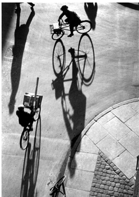
5. Heinrich Heidersberger: Laederstraede, Kopenhagen 1935 © Institut Heidersberger, www.heidersberger.de .