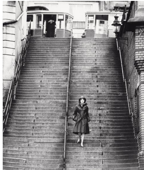
8. F.C. Gundlach, Modereportage für Nino, Hamburger Hafen 1958