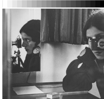
4. Ilse Bing: Selbstporträt in Spiegeln, 1931