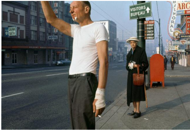
13. Fred Herzog: Man with Bandage, 1968.