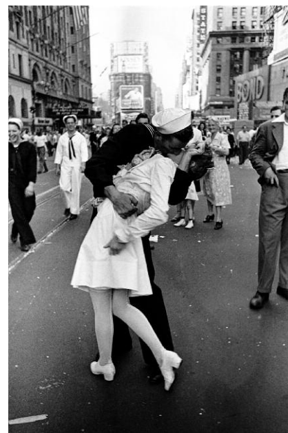
6. Alfred Eisenstaedt: VJ Day, Times Square, NY, 14. August 1945 © Alfred Eisenstaedt, 2014