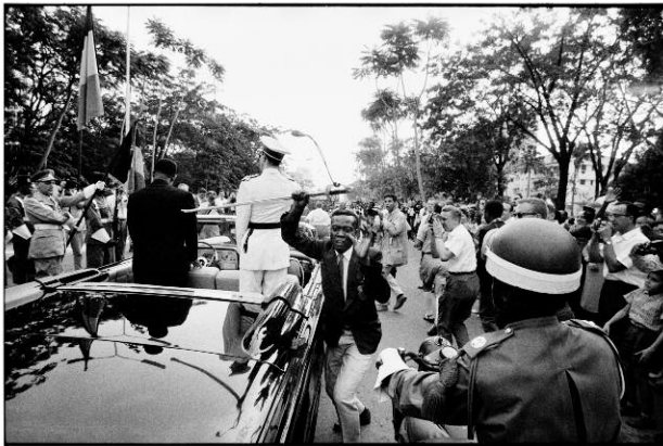
9. Robert Lebeck: Der gestohlene Degen, Belgisch Kongo, Leopoldville, 1960 © Robert Lebeck/ Leica Camera AG