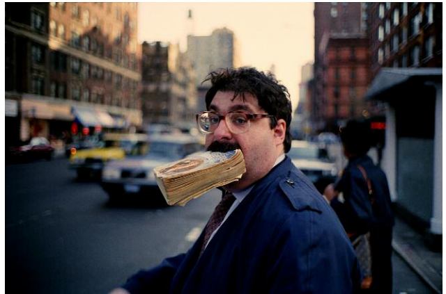
16. Jeff Mermelstein: Sidewalk, 1995