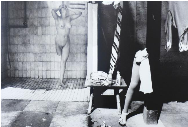
17. Michael von Graffenried: aus dem Zyklus »Nackt im Paradies«, Thielle (Schweiz), 1998