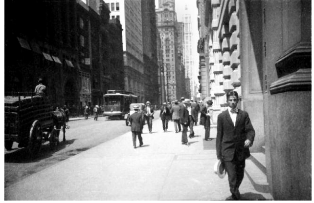
2. Ernst Leitz: New York II, 1914