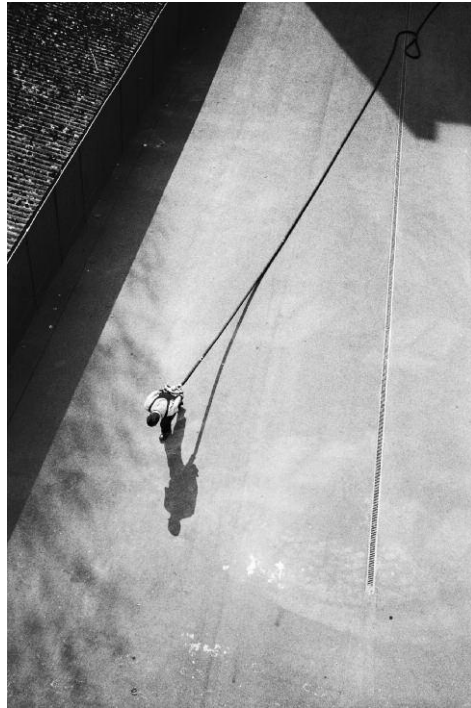
20. Julia Baier, aus der Serie »Geschwebe«, 2014.