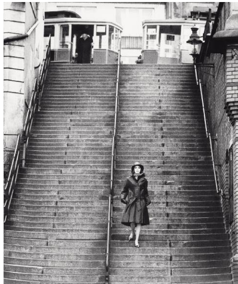
8. F.C. Gundlach, Modereportage für Nino, Hamburger Hafen 1958