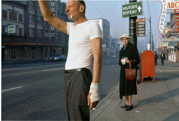
13. Fred Herzog: Man with Bandage, 1968