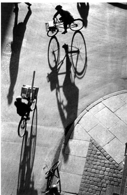
5. Heinrich Heidersberger: Laederstraede, Kopenhagen 1935 © Institut Heidersberger