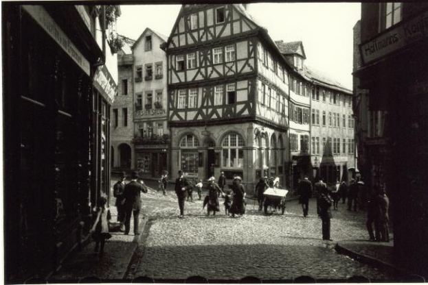
1. Oskar Barnack: Wetzlar Eisenmarkt, 1913 © Leica Camera AG