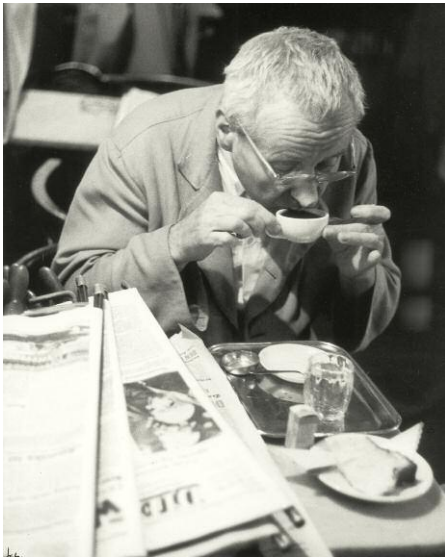
7. Franz Hubmann: Stammgast im Café Hawelka, Wien 1956/57 © Franz Hubmann / Archiv Franz Hubmann/Imagno