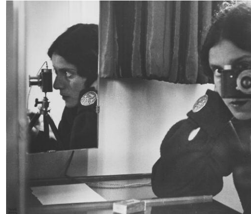
4. Ilse Bing: Selbstporträt in Spiegeln, 1931