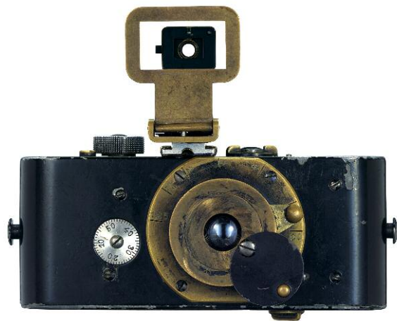
22. Ur-Leica von 1914 © Leica Camera AG