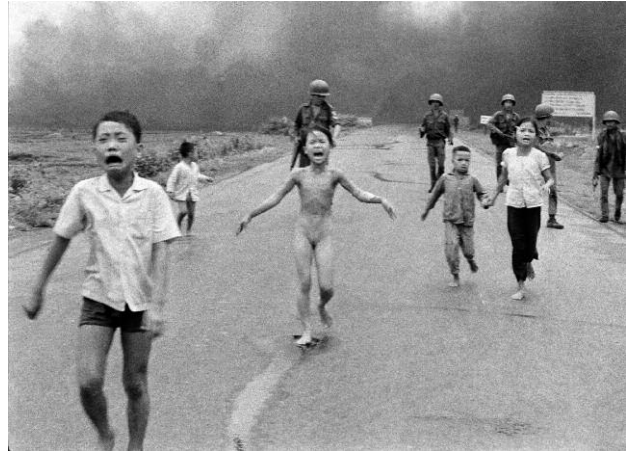
14. Nick Ut: The Associated Press, Napalm-Angriff in Vietnam, 1972 © Nick Ut/AP/dpa, Courtesy Skrein Photo Collection