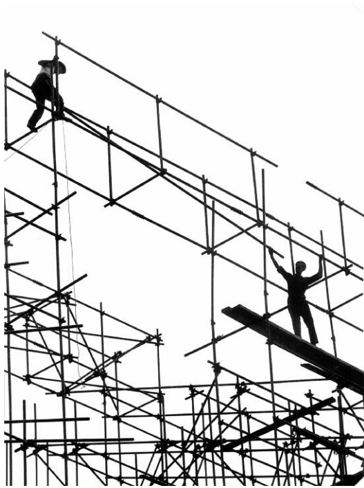
19. Hans Silvester: Stahlgerüstmontage, ca. Ende der 1950er Jahre © Hans Silvester / Agentur Focus