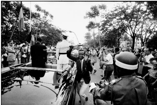
9. Robert Lebeck: Der gestohlene Degen, Belgisch Kongo, Leopoldville, 1960 © Cordula Lebeck