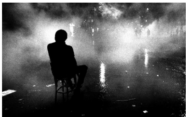
12. Claude Dityvon: »L'homme à la chaise« [Der Mann auf dem Stuhl], Bd. St. Michel, 24. Mai 1968