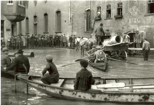
3. Oskar Barnack: Flut in Wetzlar, 1920