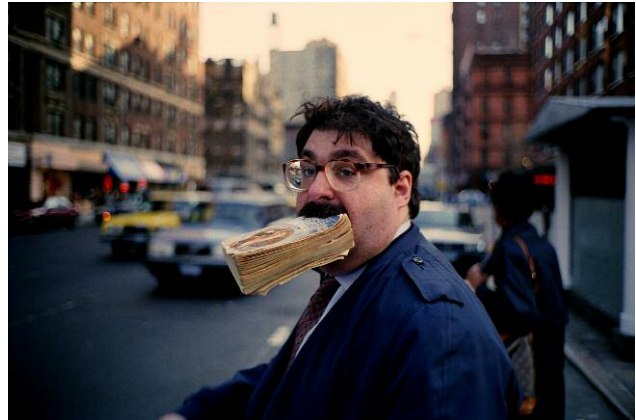
16. Jeff Mermelstein: Sidewalk, 1995 © Jeff Mermelstein