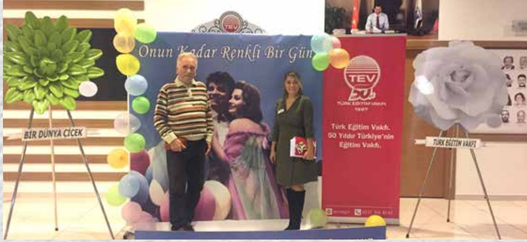
BODRUM BAĞIŞÇIMIZLA BİRLİKTE