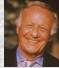
Dr. Nejat F. Eczacıbaşı