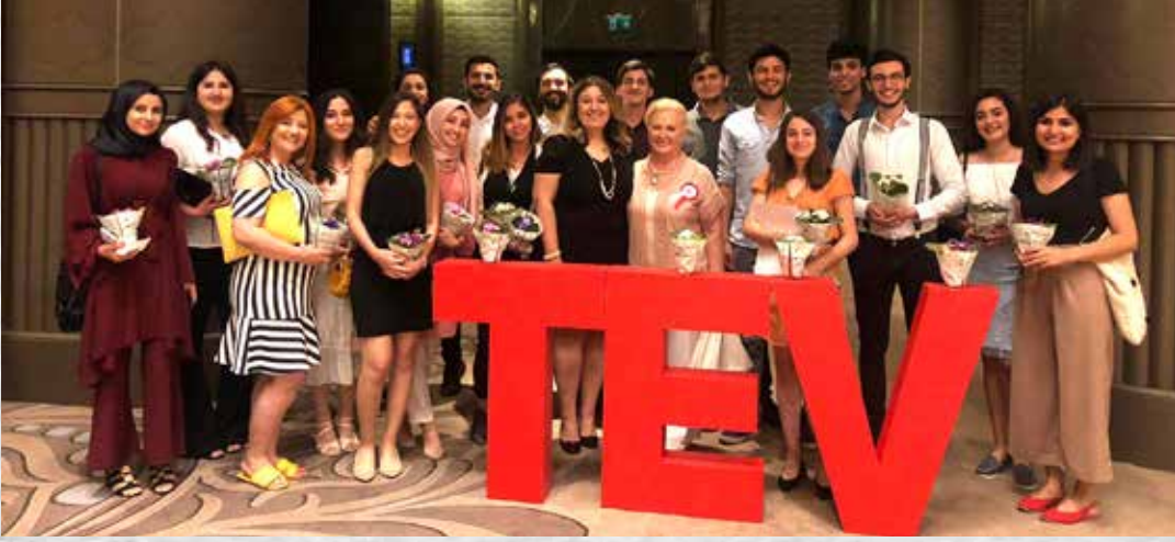
ADANA BAĞIŞÇILARIMIZ ve BURSİYERLERİMİZ BİRLİKTE