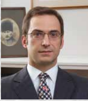
Ömer M. Koç Mütevelli Heyeti Başkanı

Vakfımız, 1967'den bu yana çağdaş ve büyüyen Türkiye'nin aydınlık geleceği için sağladığı desteği artırarak sürdürmektedir.