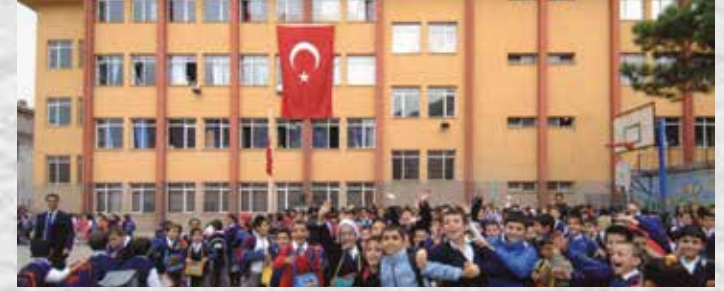
İSTANBUL/ÜMRANIYE TEV ZAHİDE ZEHRA GARRİNG İLKÖĞRETİM OKULU (1997)