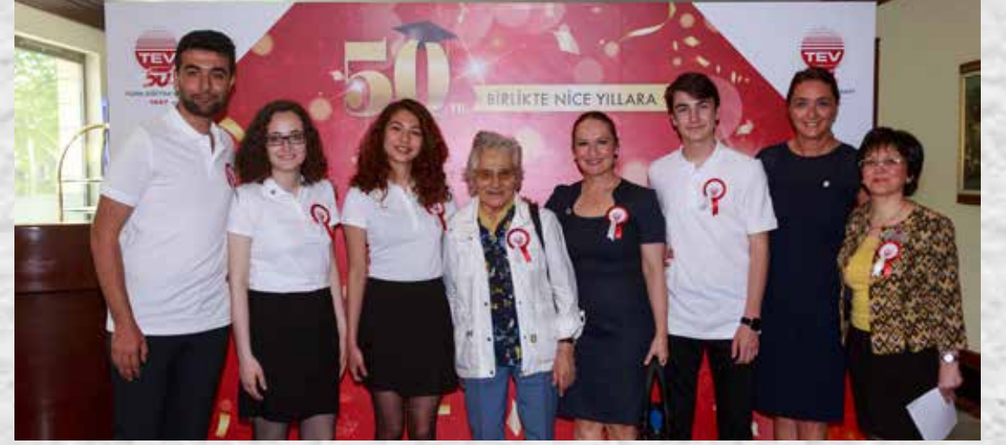
İSTANBUL BAĞIŞÇIMIZ BURSİYERLERİMİZLE BİRLİKTE