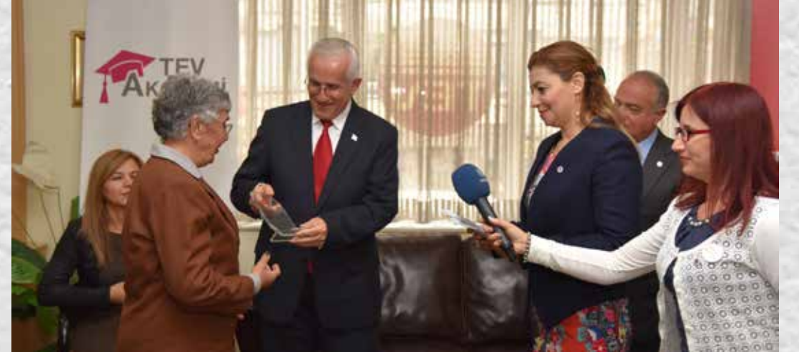
DENİZLİ BAĞIŞÇIMIZA TEŞEKKÜR PLAKETİ TAKDİMİ