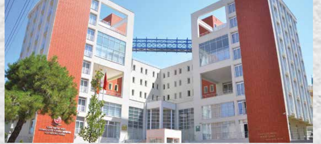
TEV İZMİR ÖZEL KIZ ÖĞRENCİ YURDU