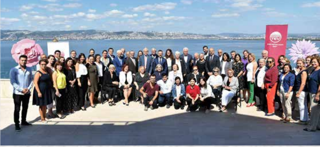
KOCAELİ BURSİYERLERİMİZE DESTEK ETKİNLİĞİ