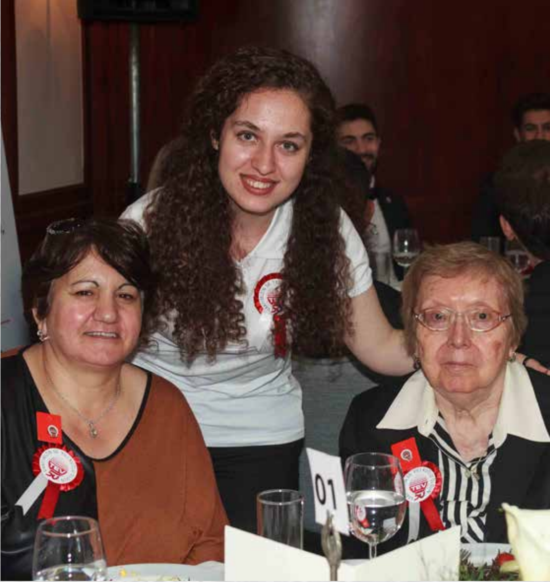
İSTANBUL BAĞIŞÇIMIZ BURSİYERİMİZ İLE BİRLİKTE KURULUŞ YIL DÖNÜMÜ YEMEĞİ