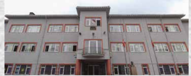
İSTANBUL/ÇENGELKÖY TEV TÜRKAN SEDEFOĞLU İLKÖĞRETİM OKULU (2001)