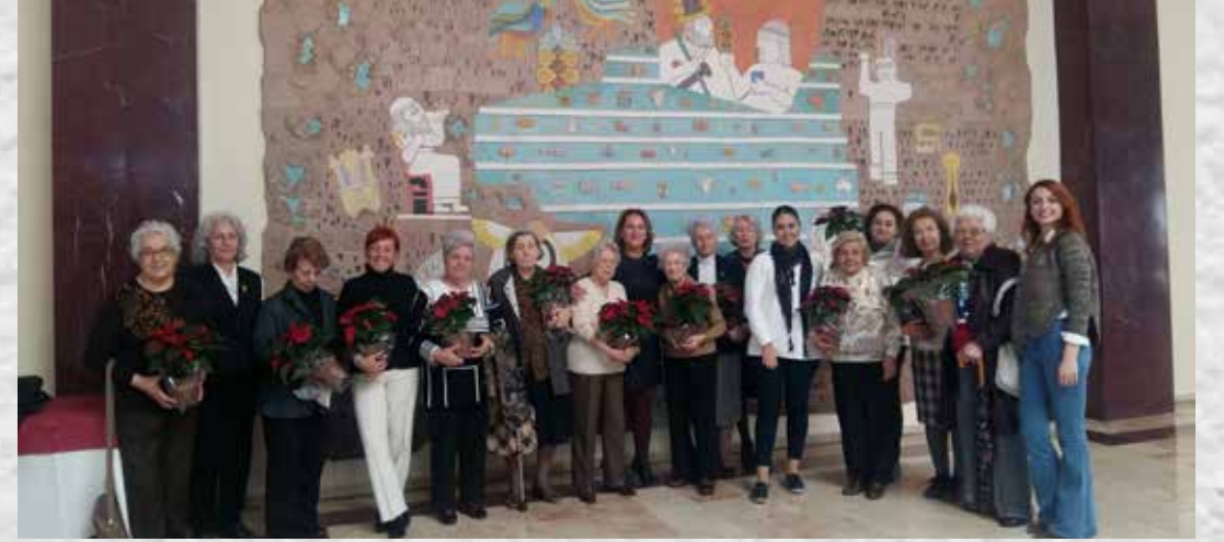
İZMİR BAĐIŐÇILARIMIZLA BİRLİKTE