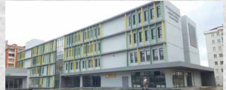
İSTANBUL/ÜMRANIYE TEV UĞUZ TARIK DEMİRAĞ MESLEKİ ve TEKNİK ANADOLU LİSESİ (2019)