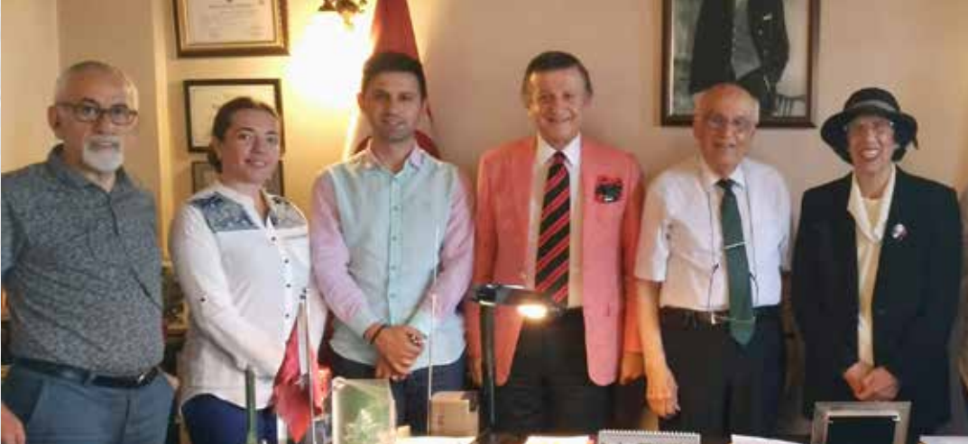
TRABZON BAĞIŞÇILARIMIZLA BİRLİKTE