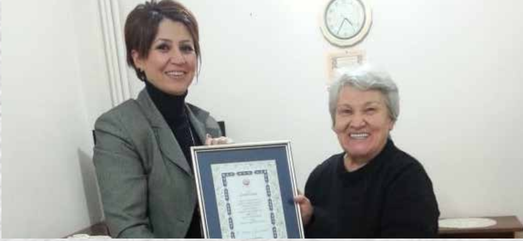
ESKİŞEHİR BAĞIŞÇIMIZA TEŞEKKÜR PLAKETİ TAKDİMİ