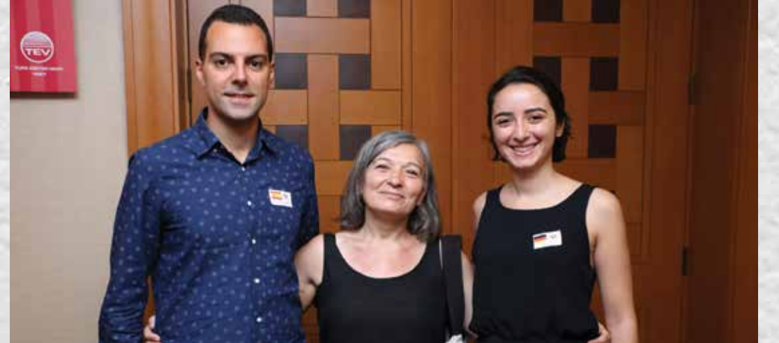
İSTANBUL BAĞIŞÇIMIZ BURSİYERLERİMİZLE BİRLİKTE YURT DIŞI BURSİYERLERİ TANITIM TOPLANTISI