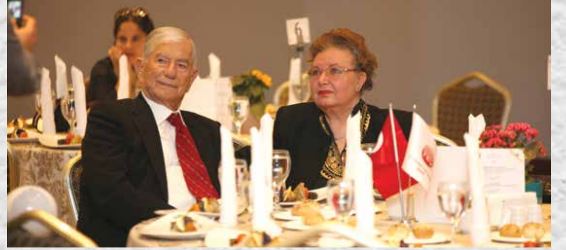
ANTALYA BAĞIŞÇILARIMIZLA KURULUŞ YIL DÖNÜMÜ YEMEĞİ