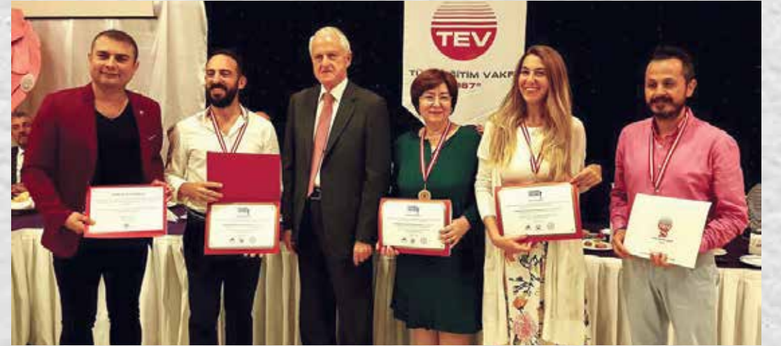
BALIKESİR GELENEKSEL KAHVALTI ETKİNLİĞİ SERTİFİKA TÖRENİ