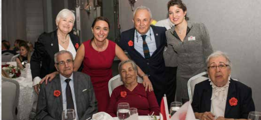
BURSA BAĞIŞÇILARIMIZLA BİRLİKTE KURULUŞ YIL DÖNÜMÜ YEMEĞİMİZ