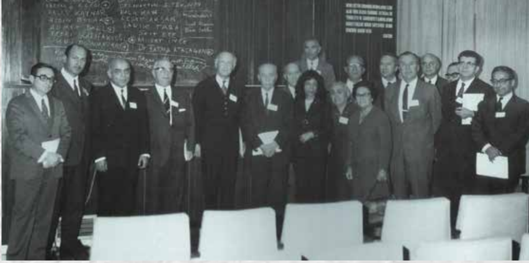
TEV GENEL KURUL TOPLANTISI (1968)