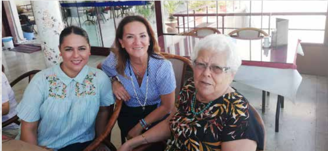
İZMİR BAĐIŐÇIMIZLA BİRLİKTE