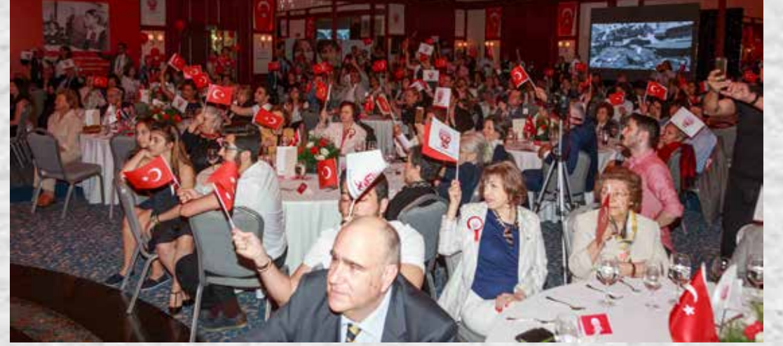
İSTANBUL BAĞIŞÇILARIMIZLA KURULUŞ YIL DÖNÜMÜ YEMEĞİ