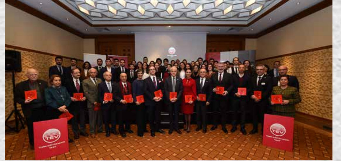
ÜSTÜN BAŞARI BURSİYERLERİ TANITIM TOPLANTISI

Teşekkürlerimizi, saygılarımızı ve sevgilerimizi sunuyorum. İyi ki varsınız!