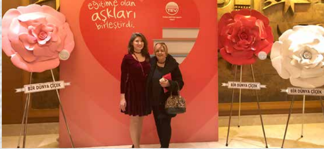
İSTANBUL BAĐIŐÇIMIZ İLE BİRLİKTE ÜSTÜN BAŐARI BURSIYERLERİ TANITIM TOPLANTISI