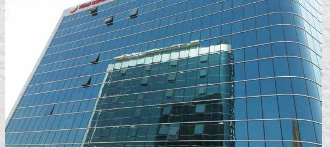
TEV ANKARA ÖZEL KIZ ÖĞRENCİ YURDU