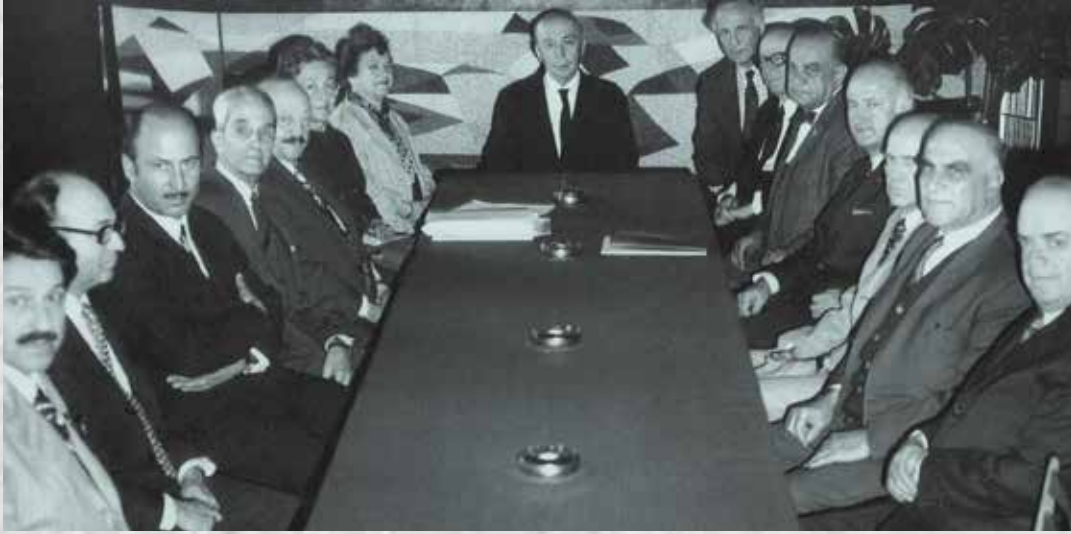
VEHBI KOÇ ve AYDIN BOLAK BAĞIŞÇILARIMIZ İLE BİRLİKTE (1971)