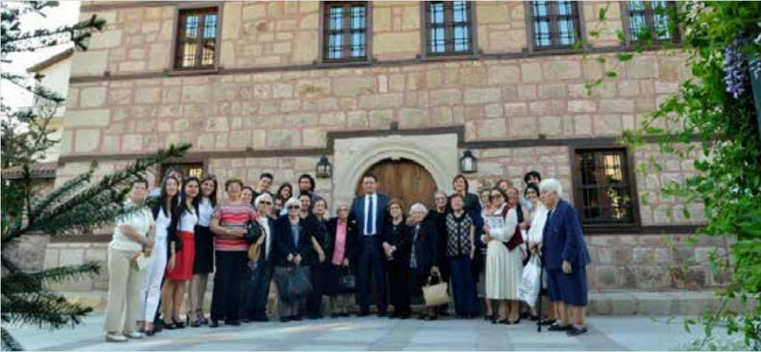
ANKARA BAĞIŞÇILARIMIZ ve BURSİYERLERİMİZ BİRLİKTE