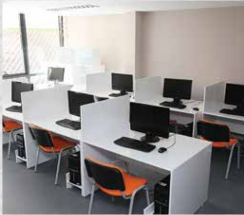
TEV TRABZON ÖZEL KIZ ÖĞRENCİ YURDU