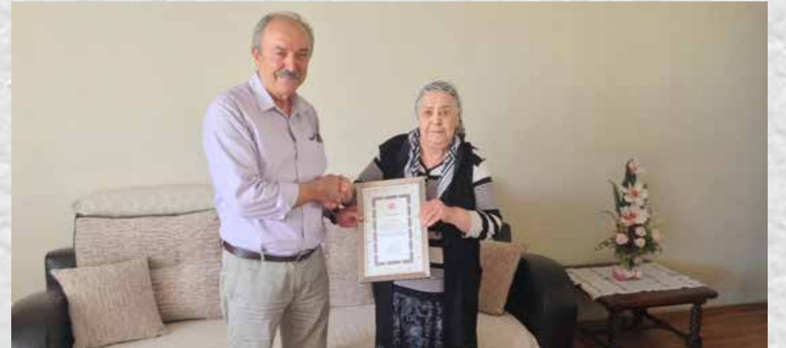
KAYSERİ BAĐIŐÇIMIZA TEŐEKKÜR PLAKETİ TAKDİMİ