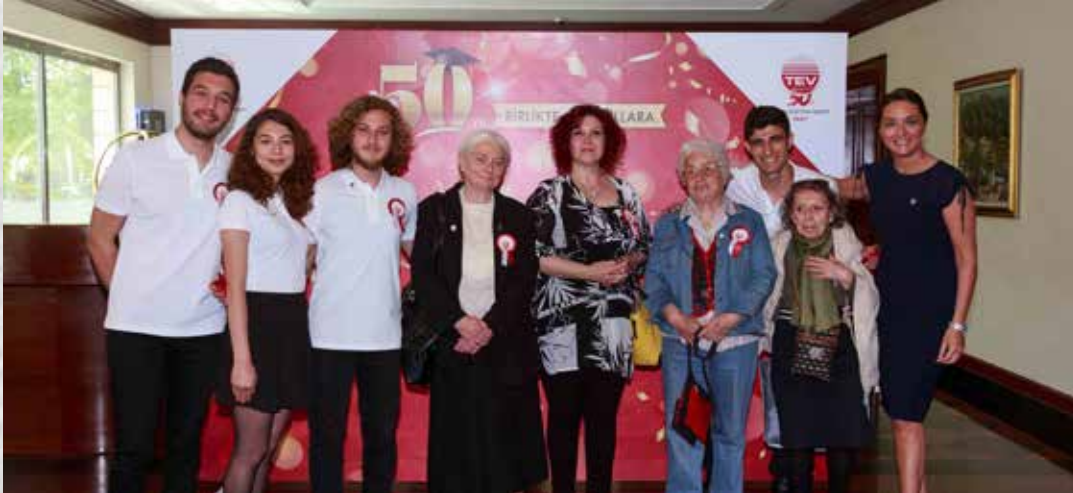
İSTANBUL BAĞIŞÇILARIMIZ BURSİYERLERİMİZLE BİRLİKTE