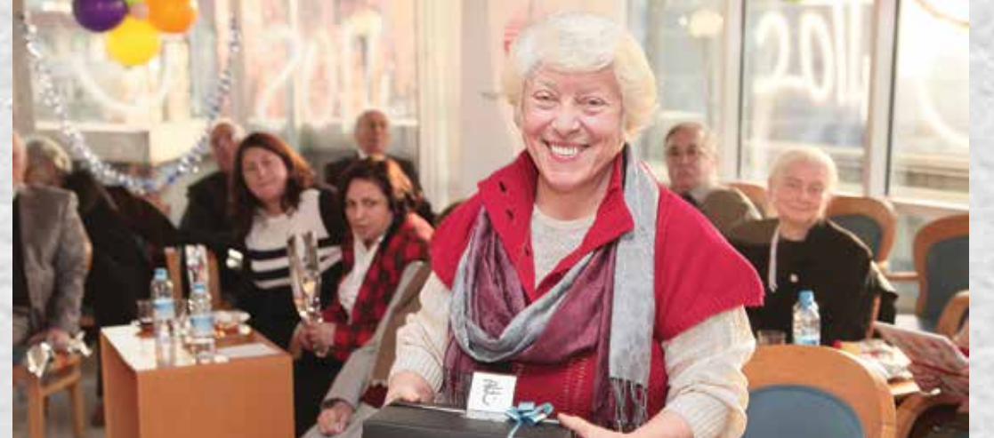
İSTANBUL BAĞIŞÇILARIMIZLA BİRLİKTE YILBAŞI ETKİNLİĞİ