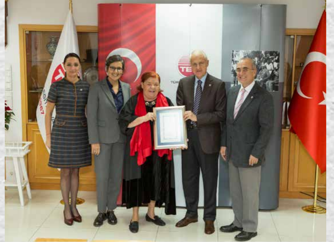
İSTANBUL BAĞIŞÇILARIMIZA PLAKET TÖRENİ