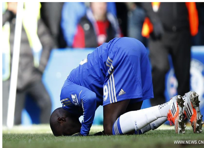
Sumber: bola.viva.co.id dan Sriwijaya Post, 12 Juli 2013

Amati foto di atas! Pemain sepak bola pasti merasa bahagia jika telah menciptakan gol ke gawang lawan. Namun, ekspresi kebahagiaan bisa berbeda, saling berangkuhan, mengepalkan tangan, berteriak histeris, atau melakukan sujud syukur di tengah lapangan hijau. Di sini tampak adanya perbedaan makna dan esensi kebahagiaan.