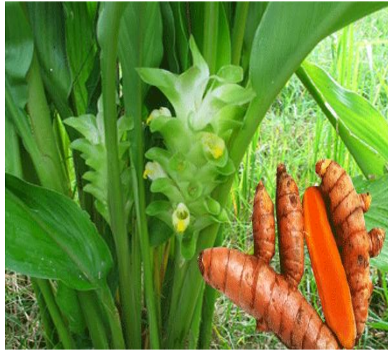
Gambar 1. Tanaman Kunyit( Curcuma domestica Val )