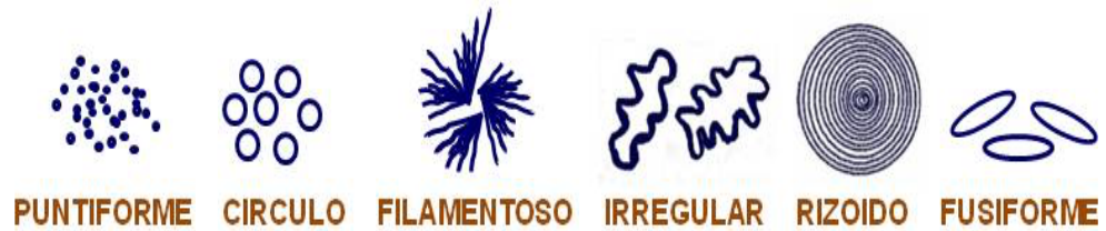
Figura 1.- Algunas características de las colonias bacterianas