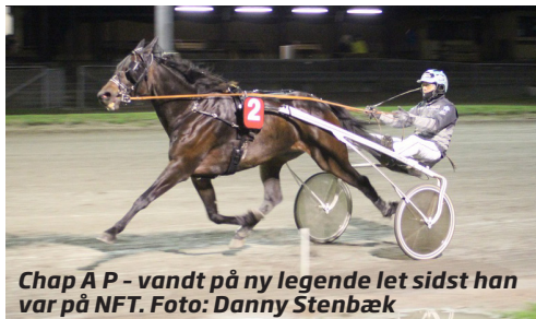
Chap A P - vandt på ny legende let sidst han var på NFT.

Fire af dagens løb er såkaldte amerikanerløb, hvor hestene stilles ind i løbene efter deres grundpræmiesum og de danner samtidig rammen om V4-spillet med nordiske puljer.