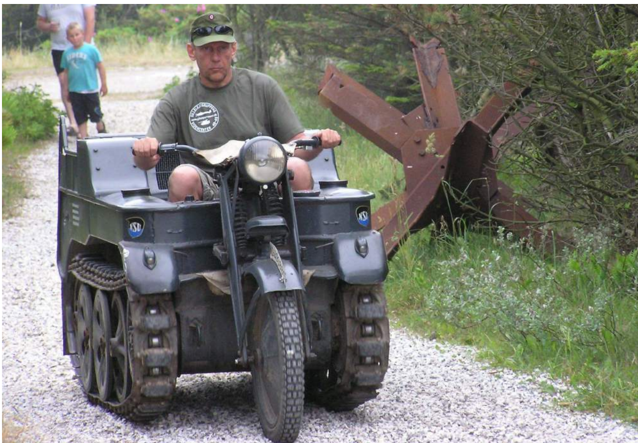
Kettenrat fra Gilleleje

Det er BSTH, som arrangerer træffet, og har du lyst at være med til at få det hele til at køre, så ring eller skriv til Esben Kaagaard - 97 92 68 20 / 40 74 27 20, ek@tp-gruppen.dk .