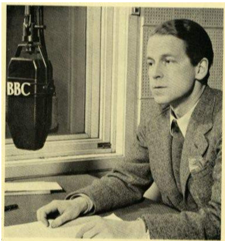
Udlaant af Frihedsraadets Udstilling.

FRA EN KÆLDER under det nordlige Fortov i The Strand talte vi til Danmark. Fra det arrede Londons muntre og bistre Hjerter søgte vi gennem Radioen at lade Sandheden tale i Stjerne hjemme, søgte at leve med i Danmarks blodige Dage, søgte at svare paa de Spørgsmaal, der hver Dag randt gennem vore Landsmænds Sind, først: - Hvem vinder Krigen? - siden: - Hvornaar er det forbi? - og: - Hvad er det, der sker i Danmark? En stor Opgave, en Fryd hver Aften at sætte sig til Mikrofonen og raabe: Her er London! saa det