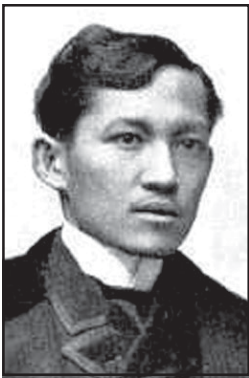
Si Dr. Jose P. Rizal

mga pinunong Espanyol at prayle. Nagalit ang mga Espanyol at siya’y dinakip at ipinatapon sa Dapitan, Zamboanga del Norte. Nang sumiklab ang rebolusyon noong 1896 isinangkot siya, inaresto at ikinulong sa Fort Santiago. Isinulat niya ang “Huling Paalam” habang nasa bilangguan siya. Binaril si Rizal sa Bagumbayan ( Rizal Park ) noong ika-30 ng Disyembre 1896.