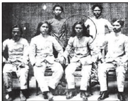
Si Macario Sakay, pangatlo mula sa kaliwa, ang nagtatag ng Republika ng Katagalugan.