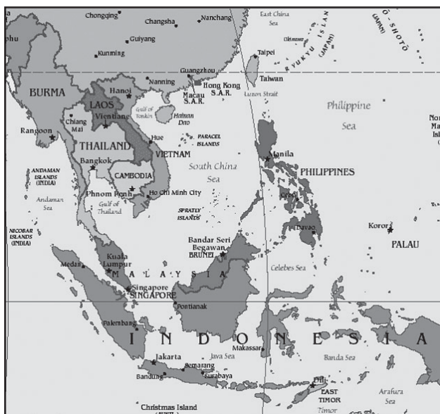
Mapa ng ASEAN

East Asia as a Zone of Peace, Freedom and Neutrality , na nilagdaan sa Kuala Lumpur, Malaysia noong Nobyembre 24, 1971, ang Asian Declaration for Mutual Assistance on Natural Disaster noong Hunyo 26, 1976, at nakilahok sa Meeting of Asian Ministers noong 1984. Pinangasiwaan sa Pilipinas ang Third Asian Summit Meeting noong Disyembre 14-15, 1987 sa Philippine International Convention Center (PICC) at sa ASEAN Tourist Forum noong Enero 23-28, 1988.