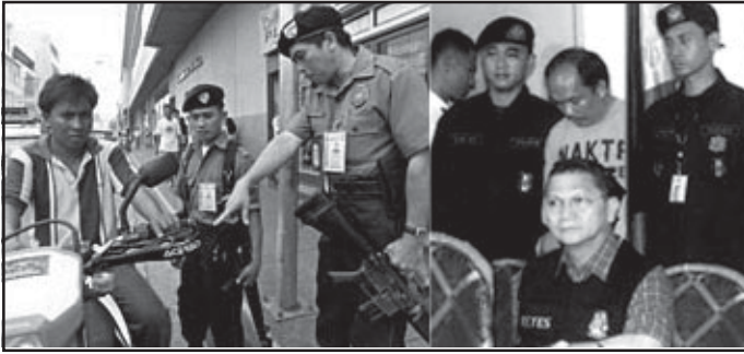
Ang mga alagad ng batas ang inaasahan ng bansa sa pagsugpo sa masasamang loob.

Ang Philippine National Police ang nangangalaga sa katahimikan at kaayusan sa loob ng bansa. Tungkulin nilang sugpuin ang mga masasamang gawain tulad ng pagnanakaw, kaguluhan, pagtitipong labag sa batas, panghoholdap, pangigingidnap, panggagahasa, pananalakay, at iba pang mga krimen.