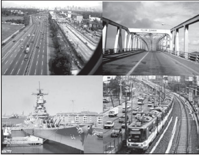
Ang mga tulay, kalsada, daungan, at mga lansangan ay ipinagawa ng pamahalaan para sa kapakanang pampubliko.

Ang mga paliparan, daungan ng mga barko, mga daan, lagusan, at piyer ay ilan sa mga pag-aari ng pamahalaan na inilalaan para gamitin ng publiko.