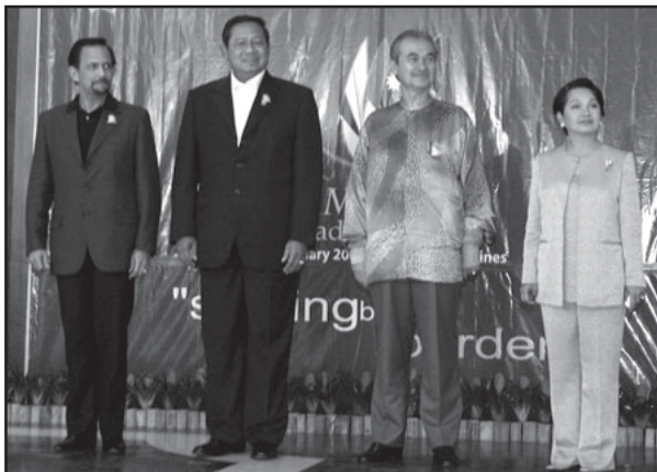
Si Pangulong Gloria Macapagal-Arroyo kasama ang ilang lider ng mga bansang kasapi sa Association of Southeast Asian Nations (ASEAN).

Ang Pilipinas ay may karapatang makipag-ugnayan sa iba't ibang bansa. Nagpapadala ang ating bansa ng mga kinatawan o ambassador sa iba't ibang bansa, kapalit nito ay tumatanggap din tayo ng mga ambassador mula sa ibang bansa na may mabuting hangarin. Bukod sa pakikipag-ugnayang pandiplomatiko, karapatan din ng bansa na makipagkalakalan at magtaguyod ng ugnayang pangkabuhayan at pangkapayapaan sa ibang mga bansa. Sa kasalukuyan, nakikipagkalakalan tayo sa Japan, China, United States, Singapore, Brunei, Nigeria, Indonesia, Malaysia, at marami pang bansa.