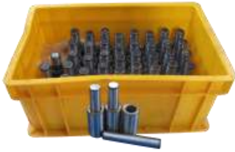
PIN & BUSH