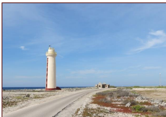
De vuurtoren op de zuidpunt van Bonaire