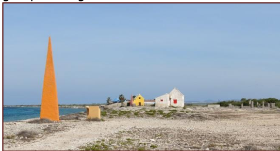
De slavenhuisjes en het oranje baken voor de zoutschepen