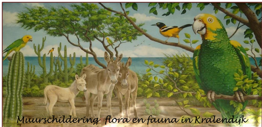
Muurschildering flora en fauna in Kralendijk

De ezels, de zoutpannen, de vogels, de Iguana's en de mooie blauwe zee zijn uitgebreid aan de orde gekomen in de Zeezwaluw Suffertjes nummer 10 , 11 & 12 . Klink op de nummers om te lezen hoe het ook alweer was.