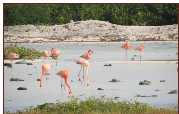
De flamingos in het Pekelmeer

Zodra je uit de auto stapt, knerpt het dode koraal onder je voeten. Zand is er niet, maar overall ligt koraal, als zand, als een soort kiezelsteentjes zo glad, of als pijpjes of grote grillige bollen. Je kunt de vorm zo gek niet verzinnen of het ligt er wel. Daarnaast zie je her en der verspreid lage struikjes of cactussen in de droge zoute omgeving.