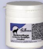
Ballenpflege Zur intensiven ganzjährigen Ballenpflege

Die tägliche Ballenpflege ist besonders im Winter unumgänglich. Durch Eis- und Schneekristalle ziehen Hunde sich immer wieder Verletzungen zu, die durch aggressive Streumittel noch verschlimmert werden. Auch Hunde, die viel auf Asphalt laufen, benötigen eine regelmäßige Ballenpflege. Die Haut wird rissig und trocken und der Hund leidet Schmerzen. Dr. Hesse Ballenpflege(öl) bietet durch seine pflegenden und schützenden hochwertigen Inhaltsstoffe den notwendigen Schutz.