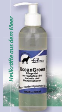
OceanGreen Haut-Pflege-Gel bei Juckreiz u. Hautirritationen

Dr. Hesse Cleaner ist ein sehr aktiver Reiniger, der als Shampoo am Tier, sowie auf allen Oberflächen eine stabile und gesunde Mikroflora durch probiotische Bakterien ausbildet. Der Cleaner reinigt das Fell schnell und besonders gründlich ohne scheuern oderbürsten und ist biologisch abbaubar.