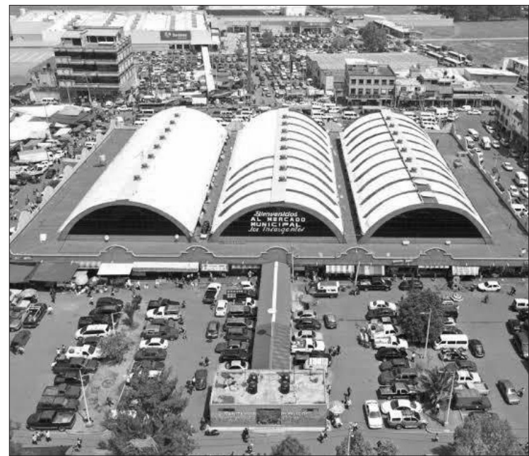
▲ El inmueble opera desde hace 40 años.

Otros casos, indicó, son de perros y gatos negros, también sin cabeza y sin patas; pero este sería el primero donde hallan pieles de animales presuntamente desollados.