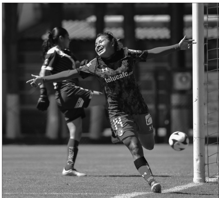
▲ El equipo acumula 13 unidades.

Vencen al Puebla, sumaron sus primeras 50 victorias en la Liga MX Femenil, y se mantienen invictas en la campaña