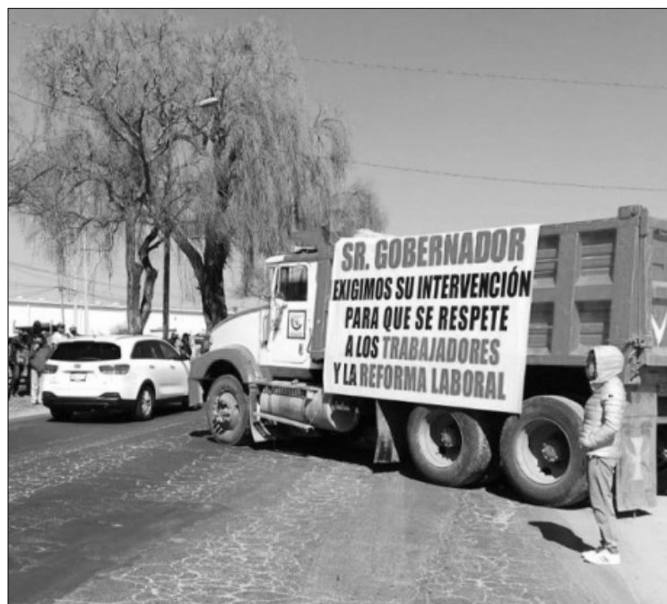
▲ Los manifestantes cruzaron sus pesadas unidades sobre los carriles, impidiendo el tráfico.

Durante los cierres, esta vía se vio afectada, pues además de la manifestación también hay trabajos de pavimentación y bacheo en la zona.