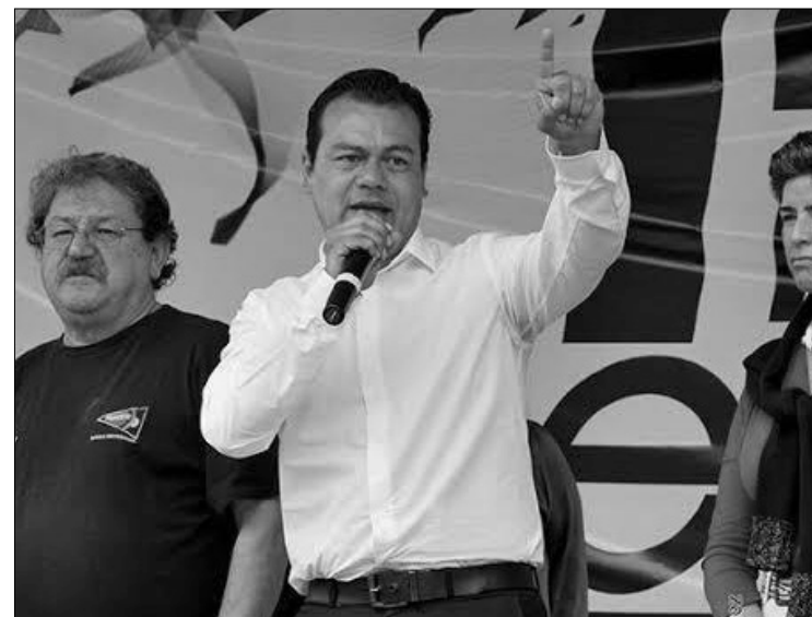
▲ El senador anunció sus intenciones de continuar su carrera política como alcalde de su ciudad natal.