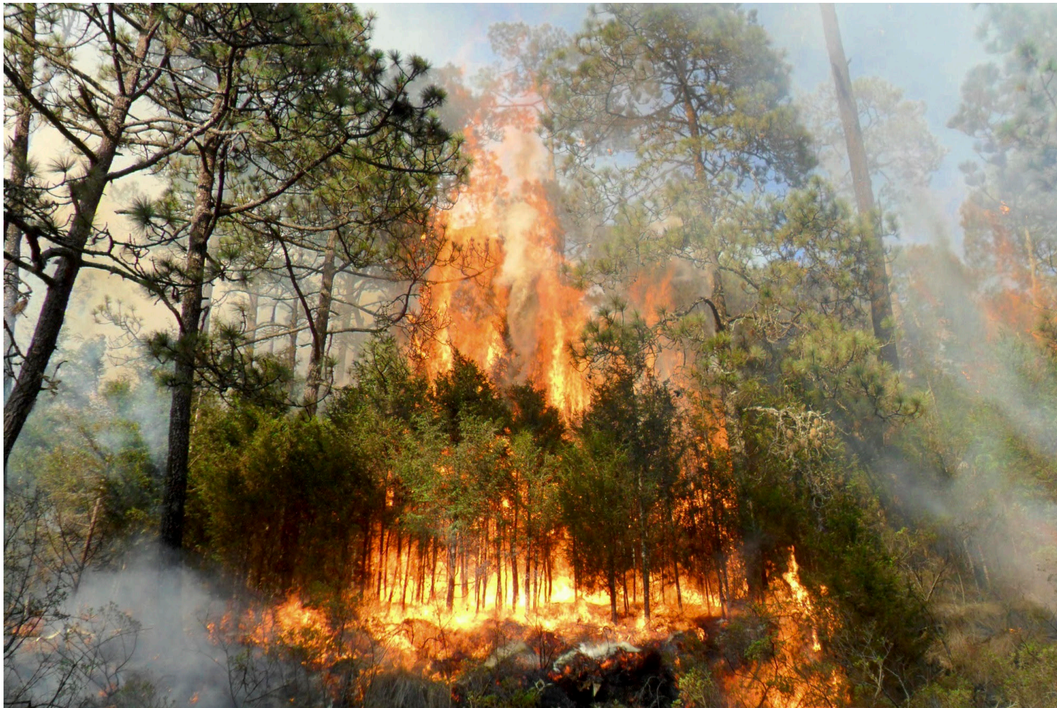
▲ Las conflagraciones atacadas corresponden a mil 690 hectáreas de arbustos y pastizales..