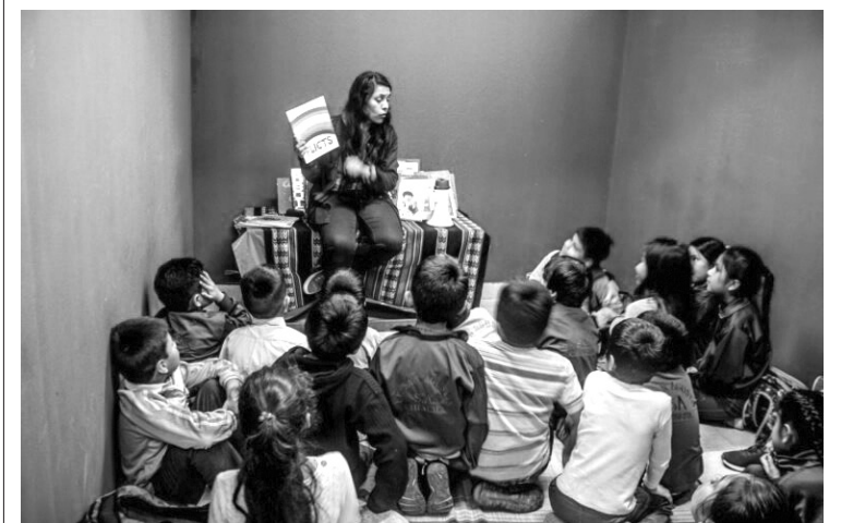
▲ El principal objetivo es promover la lectura.