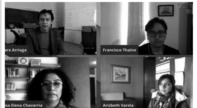
▲ El conversatorio virtual, fue encabezado por el titular de la Dirección General de Bibliotecas, Marx Arriaga Navarro.

La invitación está para que el personal de la Red Nacional de Bibliotecas Públicas (RNBP) se inscriban a los cursos y convocatorias y estar pendientes de las actividades y eventos del Año Iberoamericano de las Bibliotecas, en la página www.iberbibliotecas.org