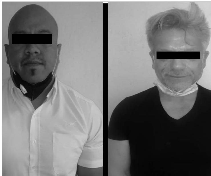
▲ Estanislao "N" y Jaime "N" son investigados por el delito.

flagrancia ocurrió luego de que se les entregó la suma de 20 mil pesos y tras practicarles una revisión, se les decomisó un arma de fuego Marca Pietro Beretta, calibre 380, con un cargador abastecido y 13 cartuchos útiles, así como una réplica de pistola de la marca Winchester de color negro con café.