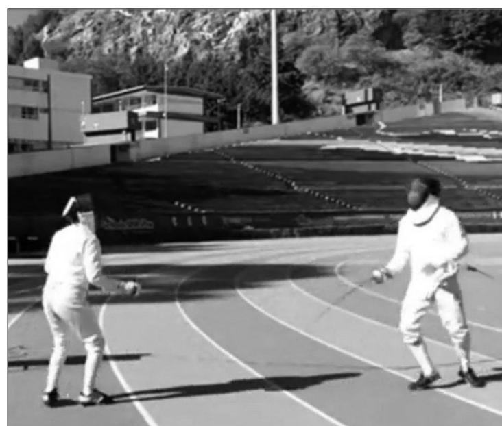
▲ Dos jóvenes durante la demostración de esgrima.

desarrolló con las aportaciones teóricas de los propios promotores deportivos, por lo que se reconoció su figura dentro de la universidad mexiquense, ya que son ellos los encargados de difundir y promover el deporte de manera directa con los estudiantes