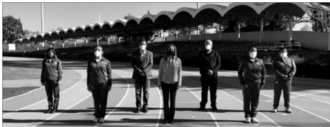
▲ La transmisión se realizó desde el estadio universitario Alberto "Chivo" Córdova.