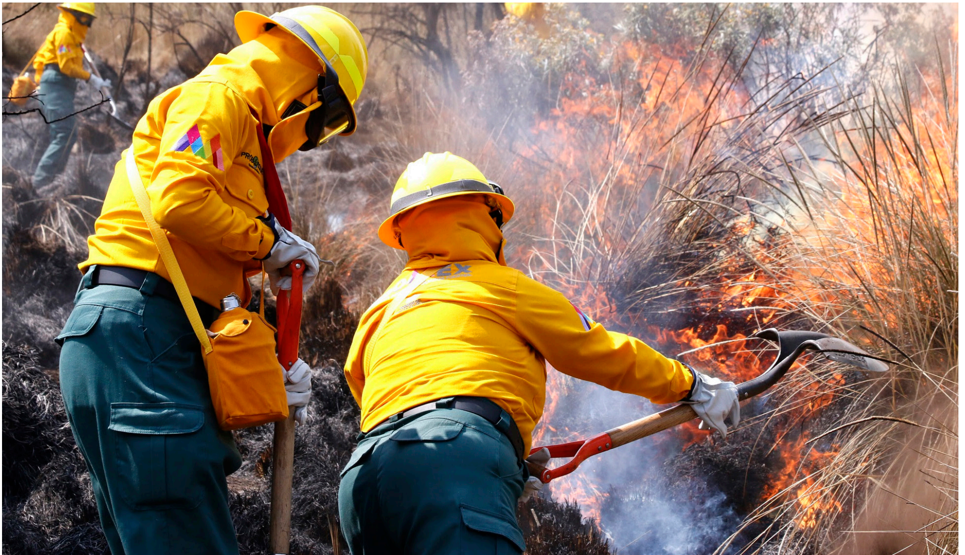
▲ Brigadistas han apagado al menos 74 siniestros forestales en municipios como Ixtapaluca, San José del Rincón, Acambay, Jilotzingo, Ocuilán y Villa de Allende. Pág. 8

| SOFOCAN 74 INCENDIOS DURANTE ENERO EN EDOMEX