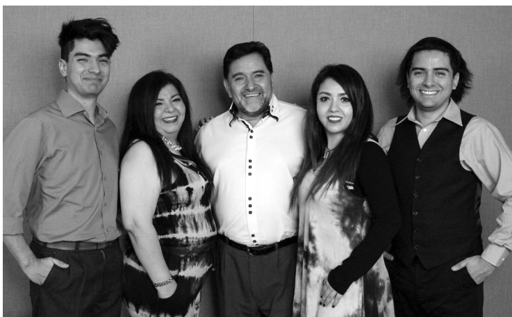
▲ La agrupación interpretó sones chiapanecos y veracruzanos.

El concierto está disponible en las redes sociales de Facebook y Twitter @CulturaEdomex.