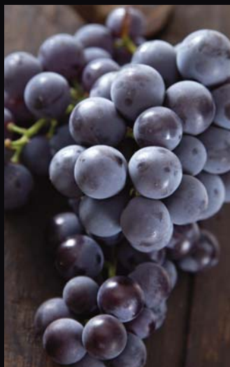
NERO DI TROIA

Il vitigno principe delle nostre zone. Elegante, austero, raffinato. Richiede passione, competenza ed esperienza per poter dare il meglio di sè.