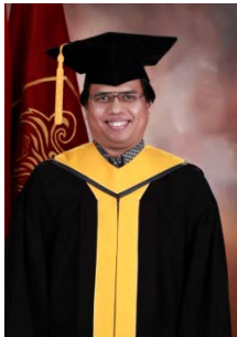
PEMBANTU DEKAN I