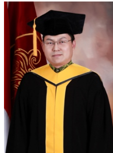
PEMBANTU DEKAN II