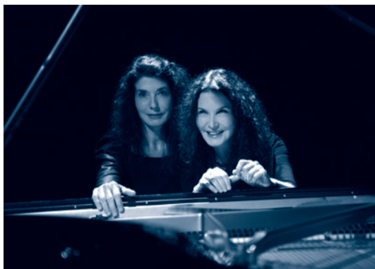
Katia et Marielle Labèque

Avant-propos autour de Pierre Boulez par Bertrand Chamayou, 18:00 Espace Malraux, entrée libre