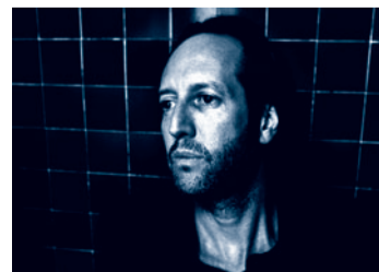
Soirée Club impro