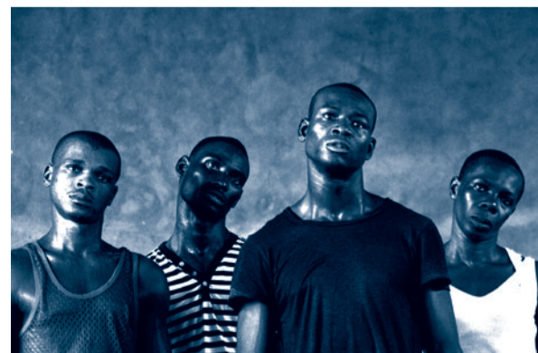
No Rules (anything goes)