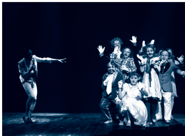
La Visite de la vieille dame