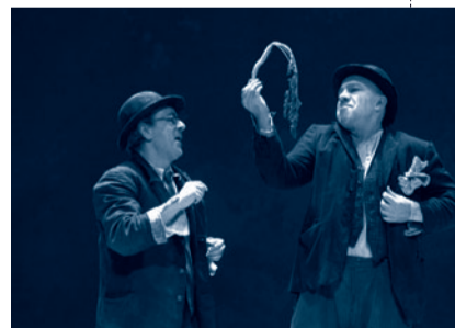
En attendant Godot