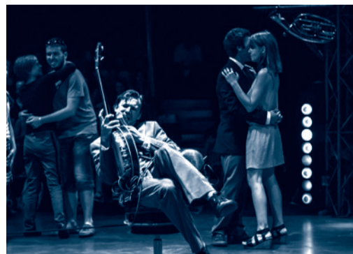
Ici ou là, maintenant ou jamais