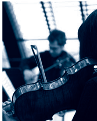
Impromptu #3 Offenbach

C'est toute une époque que fait revivre la musique nerveuse, vive et électrique d'Offenbach. Réunis en petite formation, les musiciens de l'Orchestre de l'Opéra de Lyon nous en font apprécier l'alchimie savante, entre tendresse, folie et, bien entendu, gaieté.