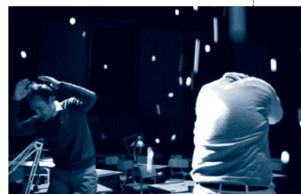
Z comme zigzag