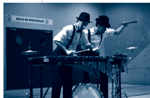
Impromptu#2: Opus Rictus