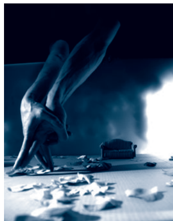
Kiss and cry