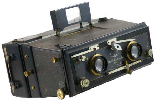
Càmera "La Francia", tipus "Jumelle", estereoscòpica convertible en panoràmica, amb objectiu E. Krauss amb llicència Zeiss. Format 6x13 cm. Fabricant Mackenstein, Paris, 1890.