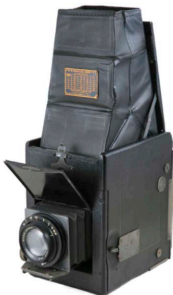
R.B. Graflex-Series B 4X5". Càmera de premsa reflex d'objectiu únic (SLR), per a plaques 10x12 cm (4x5 polzades), amb objectiu Ross Xpress 1:4.5. Fabricant Folmer-Schwing Division. Eastman Kodak Co. Rochester. N.Y. Estats Units, 1923.

Ben aviat la indústria fotogràfica va voler donar resposta a les necessitats de tota mena d'usuaris. Per evitar l'escandalosa presència que molts fotògrafs no podien evitar amb tots els seus equipaments, van aparèixer opcions imaginatives que permetien una total discreció. Les càmeres "dissimulades" van ser moltes i molt variades. Càmeres-llibre, càmeres "botó" ocultes sota les armilles, falsos binocles o càmeres-rellotge, van formar part dels catàlegs dels distribuïdors i fabricants més reconeguts.