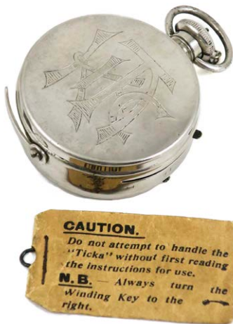
Ticka. Càmera-rellotge. Fabricada per Houghtons, Londres. 1906.

Assequible per a uns pocs en el seu moment de mecànica precisa i definició excel·lent. Avui dia és una càmera singular i difícil de trobar. La riquesa de la col·lecció la trobem en la varietat, la representativitat cronològica i el volum de peces. Algunes peces són importants per la seva raresa, el seu valor o perquè representen tècnicament una clau de volta en la manera de fotografiar, que van permetre punts de vista i narratives noves, i amb elles una influència directa en la manera de veure el món, condicionant l'opinió d'una societat cada cop més àvida d'imatges.