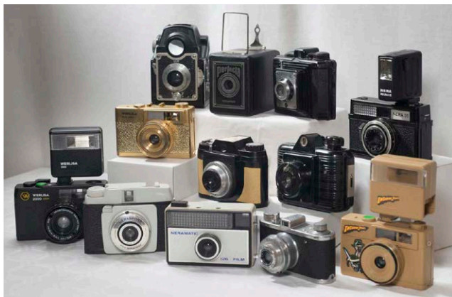
Càmeres de fabricació nacional, de diferents èpoques: Capta, Regis, Univex, Nera, o la conegudíssima Werlisa.

Aquesta càmera va ser un dels models estrella de la marca i va servir per modernitzar molts dels vells estudis fotogràfics del país.