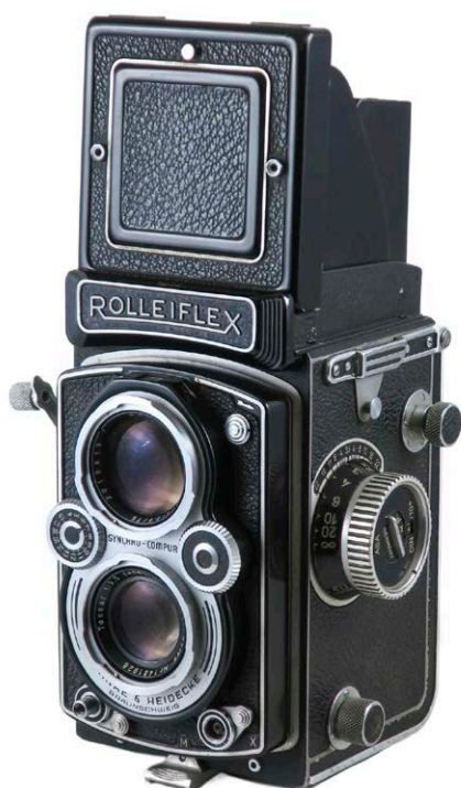
(Rolleiflex 3.5B -K4b-, format 6x6, amb objectiu Zeiss Tessar. Alemanya, 1966.

Leica va obrir un nou camí, que van seguir altres marques, algunes rivals de prestigi com les Contax de la casa Zeiss-Ikon. A la col·lecció Miquel Galmes trobem una gran varietat de models i accessoris d'aquestes marques i d'altres inspirades en elles que testimonien la importància d'aquest nou sistema.