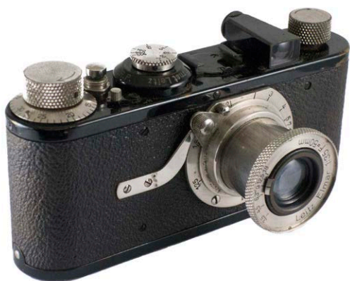
Leica I (model A), d'òptica fixa (no intercanviable), amb un objectiu Leitz Helmar 1:3,5. Fabricant Ernst Leitz, Wetzlar, Alemanya, 1929.