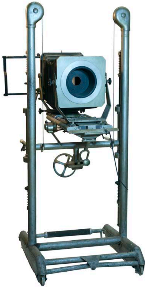
Càmera de galeria ANACA, model "standard" 18x24, fabricada l'any 1965. Estructura de columnes amb contrapesos i controls manuals de precisió de moviments, desplaçaments i descentraments de càmera. Alçada 1'90m.