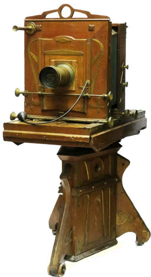
Càmera de galeria de gran format, per a plaques 18x24 cm. Fusta i metall. Fabricant Herbst & Firl, Görlitz (en associació amb Ernemann, Dresden, Alemanya). Ca.1900. Objectiu Voigtlander tipus "Petzval". F = 300 mm (?) Diàmetre - Ø 90 mm. Ca. 1860

La modernització i creixement de les ciutats va facilitar la renovació de galeries i l'aparició de nous estudis fotogràfics, amb nous serveis i una nova manera de fer els retrats que fugien de les imatges estereotipades de les últimes dècades.