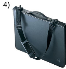
purse, pocket-book, portfolio