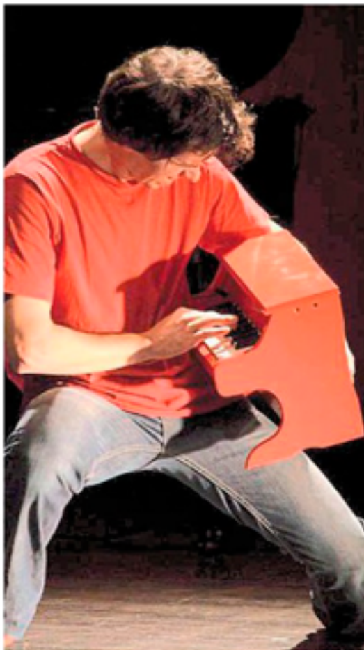
Un pianiste talentueux.

Créé et mis en scène avec Philippe Chaveau de la compagnie Zig Zag, le spectacle nous plonge dans un voyage musical avec un carnet de notes plein d'anecdotes. La balade nous transporte dans la vie de l'artiste, entre réalité et romance, de la plus tendre enfance à aujourd'hui. Tout y passe, de la panthère rose à la souris verte, de James Bond à Jean-Sebastien Bach, les airs se suivent, se croisent et s'entremêlent. Un savant mélange entre sérieux et folie douce. Le talentueux pianiste repousse les codes traditionnels du piano avec une facilité déconcertante rendant l'écoute de l'instrument accessible à tous. Le public ne lui résiste pas, il le fait chanter et même danser sur scène pour un slow revisité . Durant plus d'une heure les spectateurs en prennent plein les oreilles et les yeux avec une mise en scène pleine d'humour. La réussite est bien là, après de nombreux éloges, nombre de personnes repartent en sifflotant des airs enfouïs dans nos mémoires.