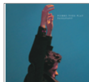
Passavant (Album solo)

Scènes à Paris : Salle Cortot, L'Archipel, Petit Journal Saint-Michel, Stade de France (salon Elyseum), L'Atelier Charonne, Les Déchargeurs, Le Sunset-Sunsid Mais aussi Théâtre Nouvelle France (LeChesnay), Théâtre de la Mare au Diable (Palaiseau), Théâtre de la Celle Saint-Cloud, Théâtre Montansier (Versailles), Théâtre de Verduze (Vitrolles), Palais de la Bourse (Marseille), Théâtre Graslin (Nantes), L'espace du Roudour (Morlaix), la Maline (Ile de Ré), Le Nautille (Foret Fouesnan), Le Carré du Perche (Mortagne au Perche), grand hall de l'hôpital (HFME) à Lyon, Centre culturel Marc Brinon (St Thibault des Vignes), Château d'Isenbourg (Colmar) Et à l'étranger : Hybernia concert hall – Prague (République tchèque), Académie des Beaux Arts (Tirana, Albanie), Cadogan Hall (Londres), Express Jazz Club (Londres), Théâtre Barnabé (Servion, Suisse), tournée aux Etats-unis et en Norvège en 2018.