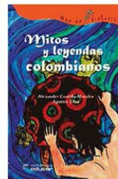
Mitos y leyendas colombianas Alexander Castillo Editorial: Educar