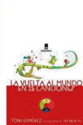
La vuelta al mundo en 25 canciones Giménez Toni Editorial: La Galera

Colección Semilla: Libros para sembrar y cosechar lectores (2014). Catálogo Colección Semilla, Plan Nacional de Lectura y Escritura. Ministerio de Educación Nacional.