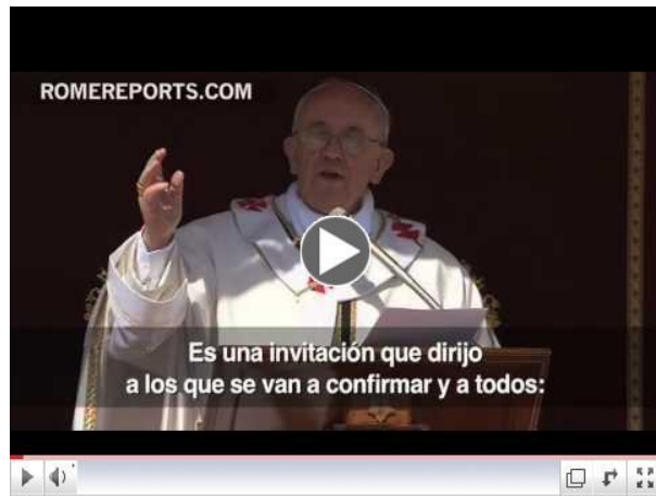
Invitación del Papa para los confirmandos

Con el Bautismo y la Eucaristía, el sacramento de la Confirmación constituye el conjunto de los "sacramentos de la iniciación cristiana", cuya unidad debe ser salvaguardada. Es preciso, pues, explicar a los fieles que la recepción de este sacramento es necesaria para la plenitud de la gracia bautismal (cf Ritual de la Confirmación, Prenotados 1). En efecto, lea más... clic