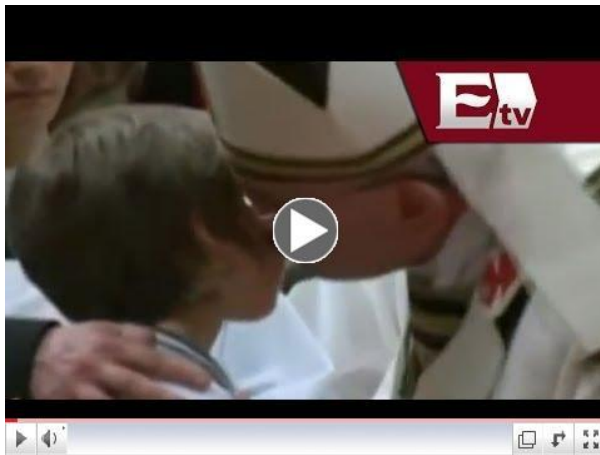
Rito de la Confirmación - baje un ejemplo. clic