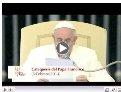
Sacramento de la Eucaristía