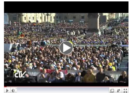
Introducción al Sacramento del Bautismo

En su carta encíclica sobre "La esperanza cristiana", El Papa Benedicto XVI explica que esta respuesta captura la meta del Bautismo: "No es...simplemente una bienvenida dentro de la Iglesia. Los padres esperan más para el que va a ser bautizado: ellos esperan que la fe, la cual incluye la naturaleza corporal de la Iglesia y sus sacramentos, siga leyendo... clic