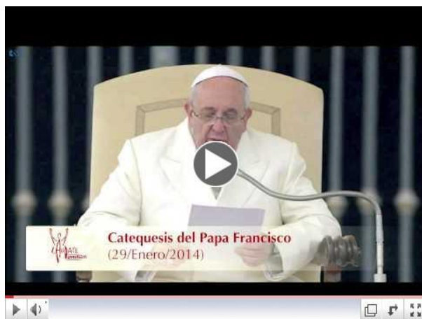
Sacramento de la Confirmación