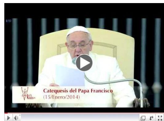
Cuerpo de Cristo: Bautismo

Puede comprar el DVD: El bautismo de mi bebé. clic