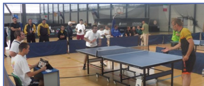
Os atletas em competição