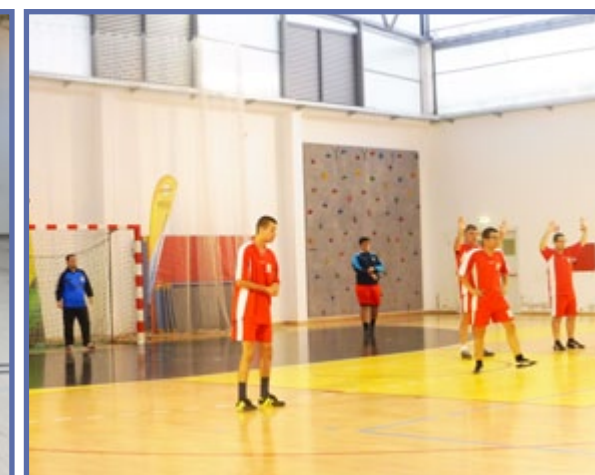
Os nossos jogadores em posição de defesa