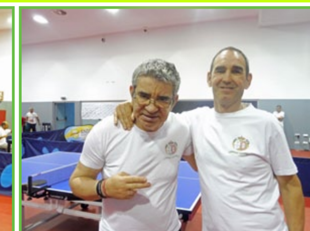
A amizade prevalece sempre