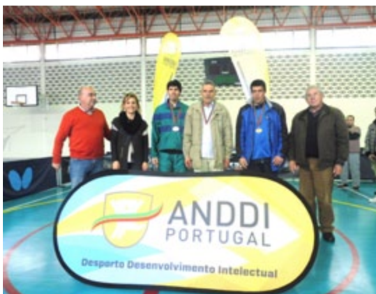
Ténis de Mesa (Pág. 05)