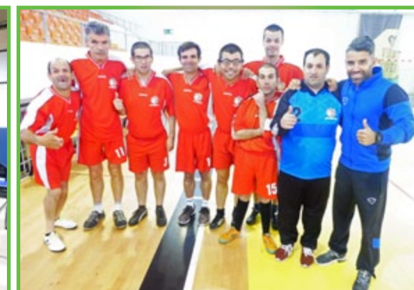
O futsal foi umas das atividades realizadas