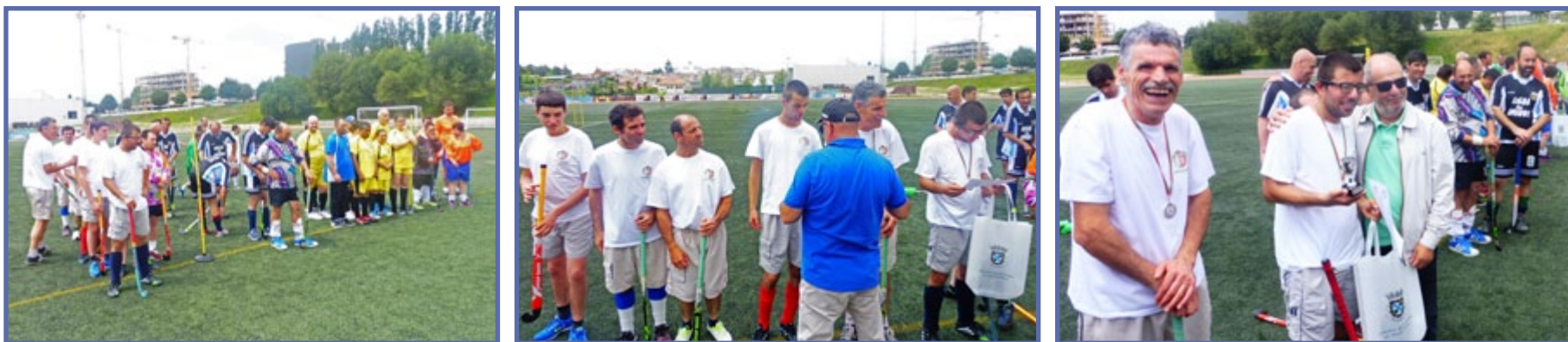
Uauu grande organização e concentração dos atletas, parabéns ;)