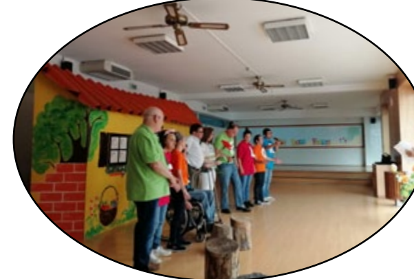
Como amantes da Natureza que somos, na peça transmitimos uma mensagem de sensibilização sobre os cuidados a ter com a Mãe Floresta