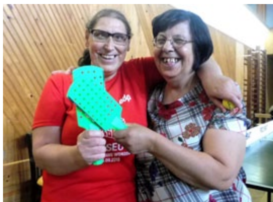
Dia Olímpico (Pág. 12)