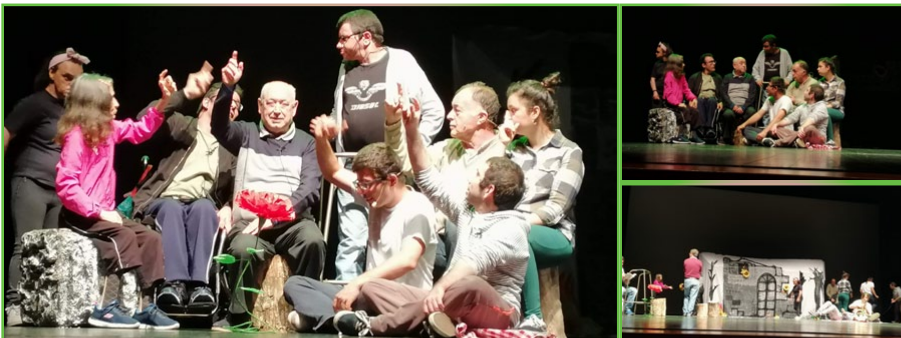
Ensaios da peça: com muita dedicação, treino, união e assertividade, chegamos ao objetivo final, com sucesso!!!!