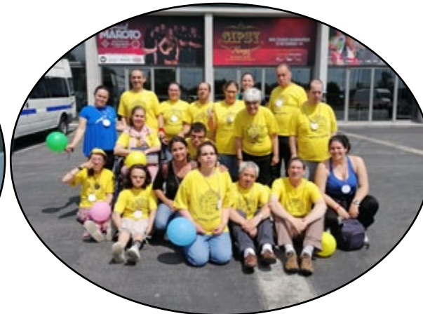
O grupo no fim dos desafios