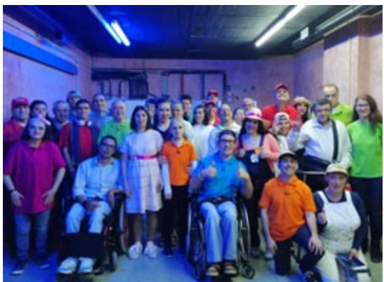
“Um Outro Olhar”(Pág. 08)