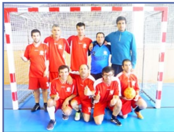
Uma equipa de elite