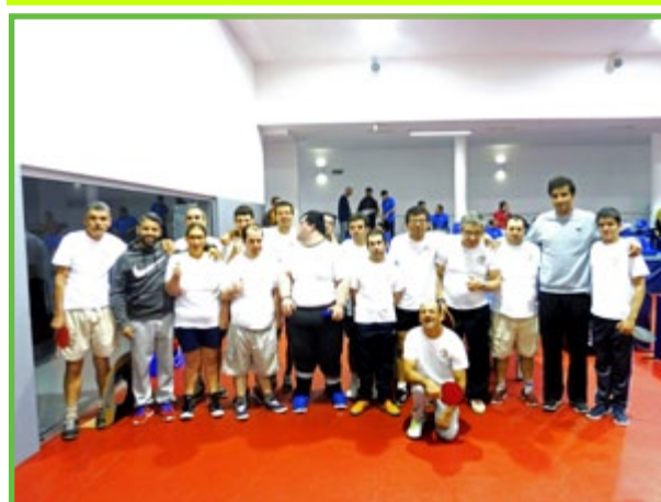
Quando a luta é de coração, tudo vale a pena