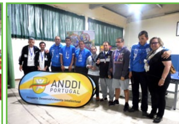
A foto da praxe :)