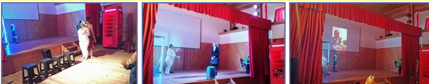
Foi um espetáculo recebido com muito entusiasmo pelos nossos utentes!!