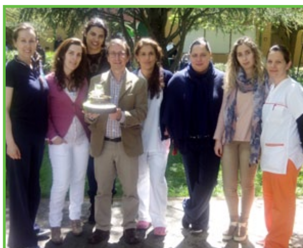
...impulsionador, entre tantas qualidades...o nosso obrigado