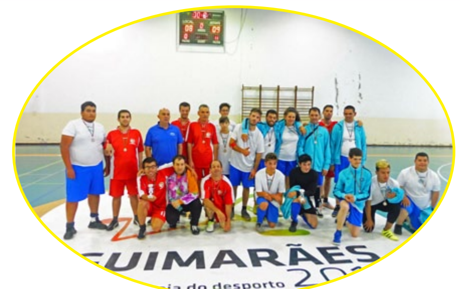
Companheirismo acima de tudo ;)