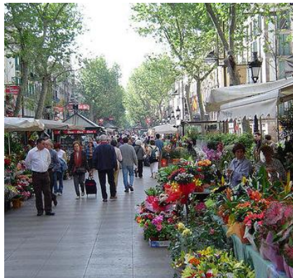
Passeig de la Rambla