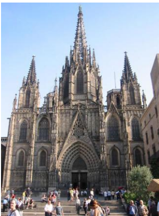
Catedral de Barcelona

Anau a Barcelona a passar el cap de setmana i decidiu escriure una postal a un amic o familiar per contar-li com us ho passau. Podeu ajudar-vos d'aquestes fotografies (40-50 paraules).