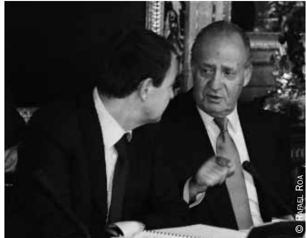
El Rey Juan Carlos y el presidente del Gobierno, en la reunión del Patronato.

La lengua es una frontera: hay personas que tienen que abandonar su lengua y otras que viven diariamente en una lengua diferente a la que sienten como propia. Pero el Instituto Cervantes trabaja para que nadie se sienta extranjero en el gran territorio de la lengua española y para que sea una frontera que no separe, sino que una: frontera de una geografía que acoge, que trabaja por la dignidad. Y sin duda el español, como lo demuestran su histo-