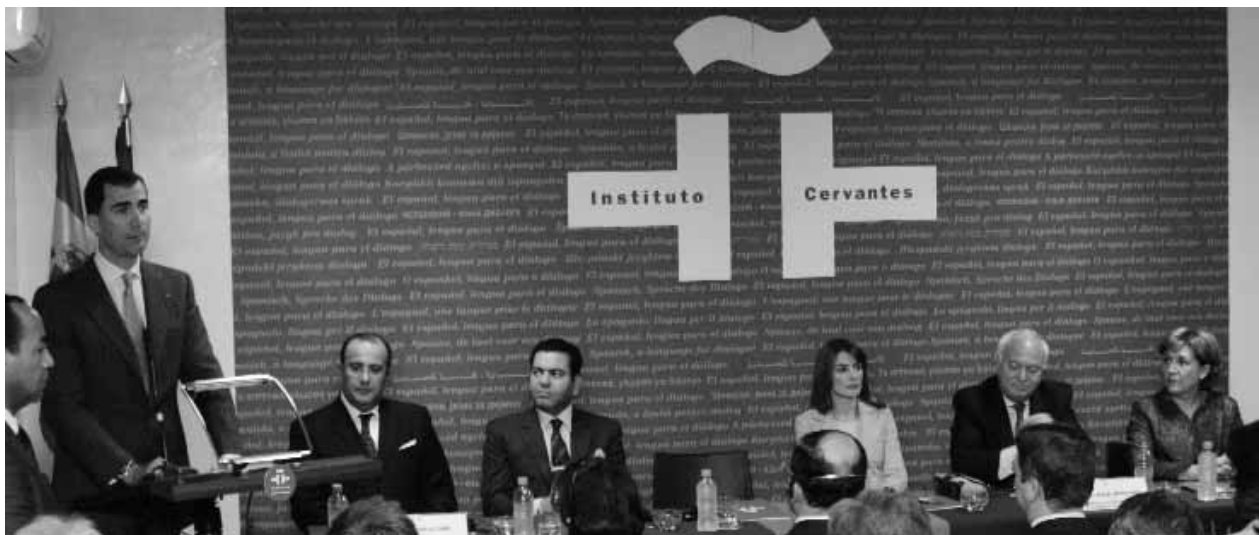
Don Felipe en el momento de dar cierre al acto de inauguración del nuevo centro del Instituto Cervantes en Marrakech. En la mesa, de izquierda a derecha, el ministro de Exteriores marroquí, el Príncipe Muley Rachid, la Princesa Doña Letizia, el ministro de Exteriores español y la directora del Cervantes, Carmen Caffarel.

Con este nuevo centro, Marruecos se convierte en el país con más centros del Instituto Cervantes: Rabat, Casablanca, Tánger, Tetuán, Fez y, ahora, Marrakech. Solo lo iguala Brasil, que también tienes seis sedes.