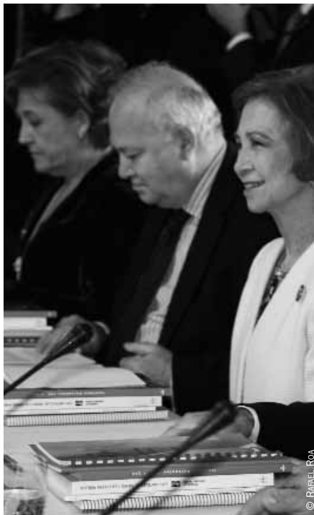
La directora del Instituto Cervantes, Carmen Caffarel; el ministro de Asuntos Exteriores y de Cooperación, Miguel Ángel Moratinos, y Su Majestad la Reina, momentos antes de comenzar el Patronato.