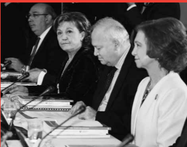
De izquierda a derecha, el entonces subsecretario del Ministerio de Asuntos Exteriores, Luis Calvo; la directora del Instituto Cervantes, Carmen Caffarel; el ministro de Asuntos Exteriores y de Cooperación, Miguel Ángel Moratinos, y Su Majestad la Reina, momentos antes de comenzar la reunión.