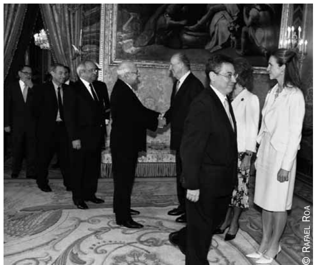
Los Reyes, antes del almuerzo, reciben a los embajadores hispanoamericanos acreditados en Madrid.