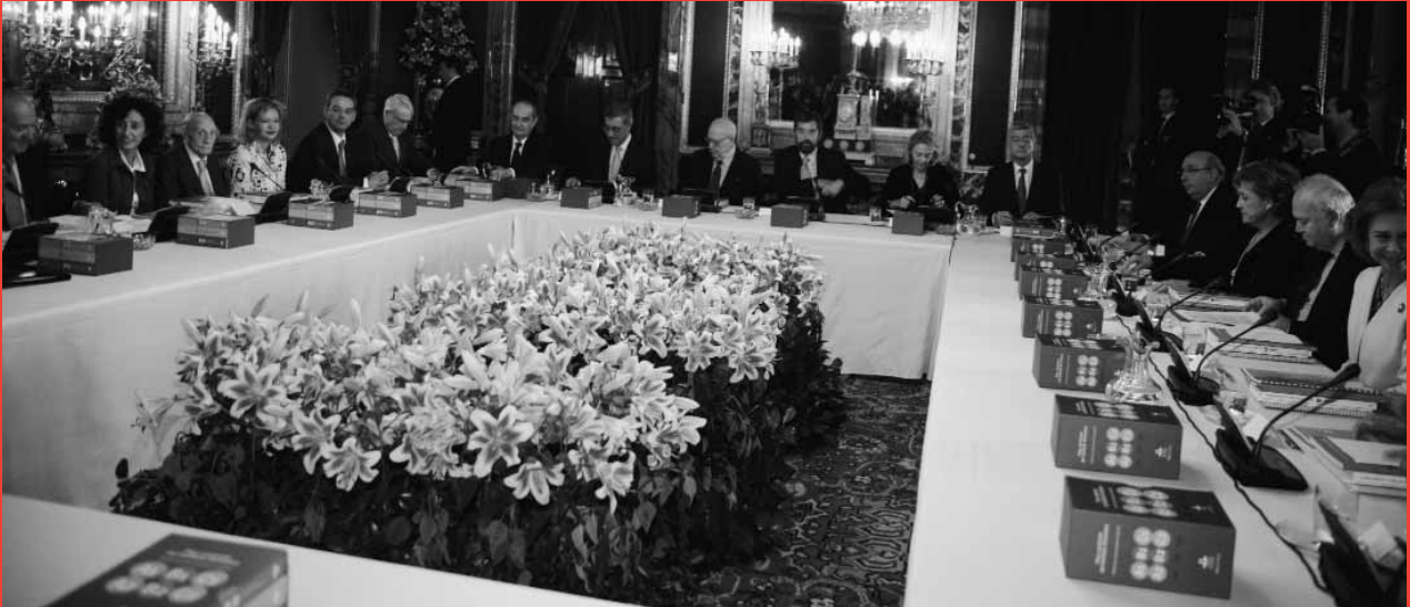
Comienzo de la reunión anual del Patronato del Instituto Cervantes en el Comedor de Diario del Palacio Real.