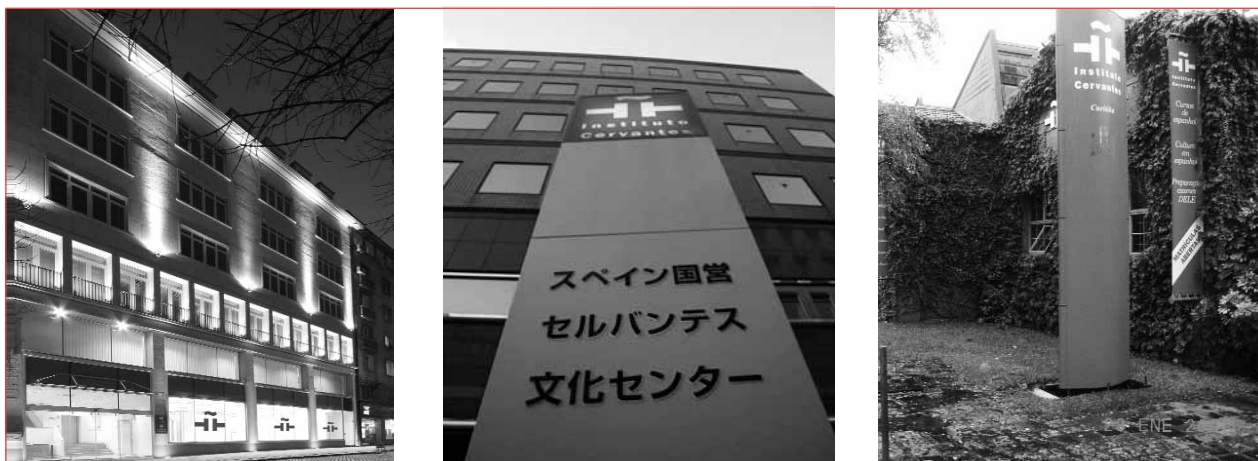
Los nuevos centros del Instituto Cervantes en Sofía, Tokio y Curitiba, uno de los últimos centros inaugurados en Brasil.

Con sus nuevas sedes en Tokio, Pekín y Nueva Delhi, el Cervantes estará presente en países con tres de las culturas más destacadas, profundas y solemnes del mundo, sin las cuales no puede entenderse