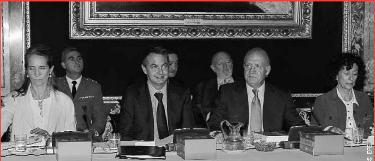
Su Majestad el Rey, acompañado por la Infanta Doña Elena, el presidente del Gobierno, y la ministra de Educación y Ciencia, preside la reunión del Patronato del Instituto Cervantes.