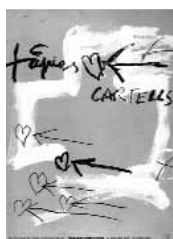
Els cartells de Tàpies i l'esfera pública, 2006