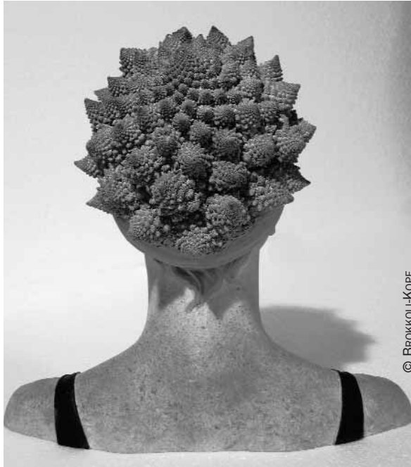
Gerard Mas Retrat de Banyista amb bròquil, II , en «Catalunya Look».

En el campo de las artes escénicas, el Instituto, también en colaboración con el Lull y el teatro HAU de Berlín, programó un festival de teatro y música que incluía piezas como el Tirant lo Blanc en dramaturgia de Calixto Bieito, una coreografía de Mal Pelo y otra