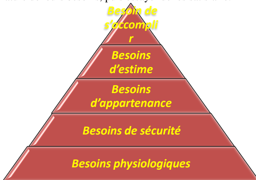
Figure 7.1 : La pyramide des besoins de Maslow

Pour inciter ses employés à travailler, un responsable doit connaître en premier lieu la nature de leurs besoins, puis essayer de les satisfaire.