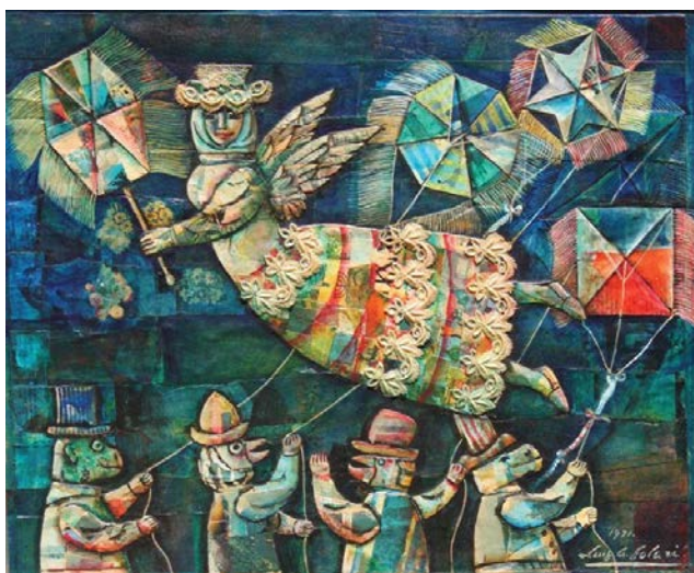
“Ángel paseadero y cometas” (1971)