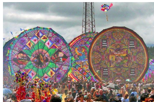
Ejemplos de volantines de Santiago de Sacatepéquez, Guatemala.