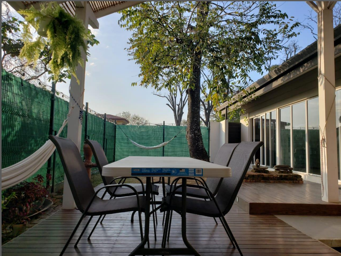
TERRAZA / DECK