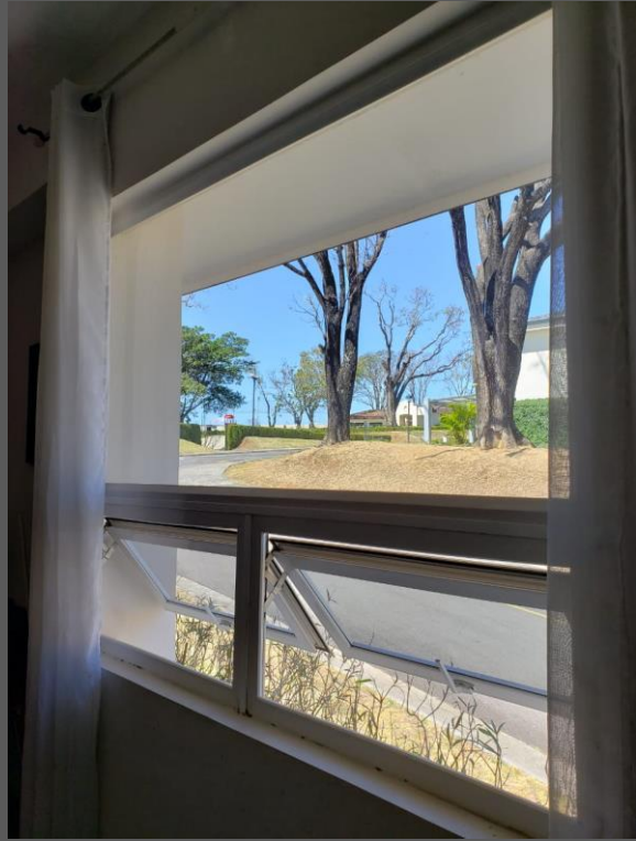
VISTA DORMITORIOS SECUNDARIOS