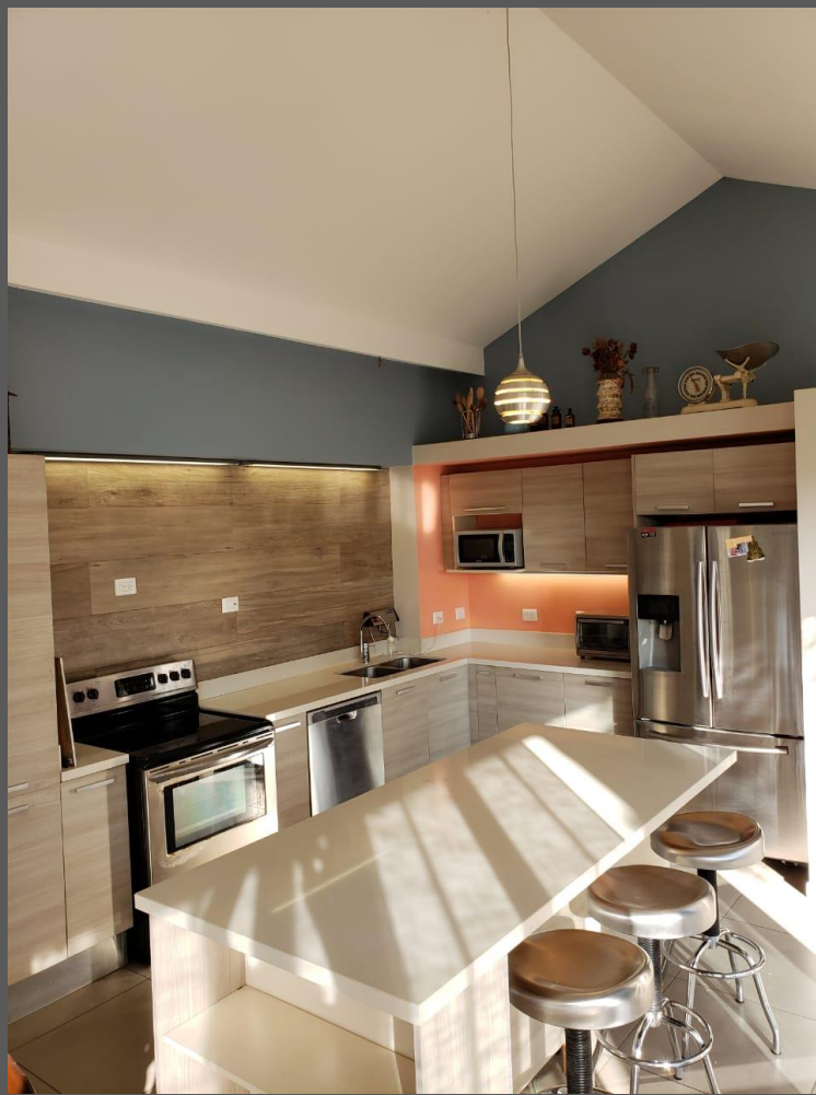
COCINA / DESAYUNADOR