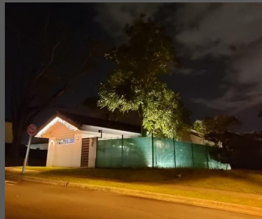
VISTAS EXTERIORES / FACHADAS