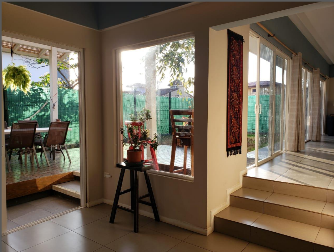
VESTIBULO / LLEGADA