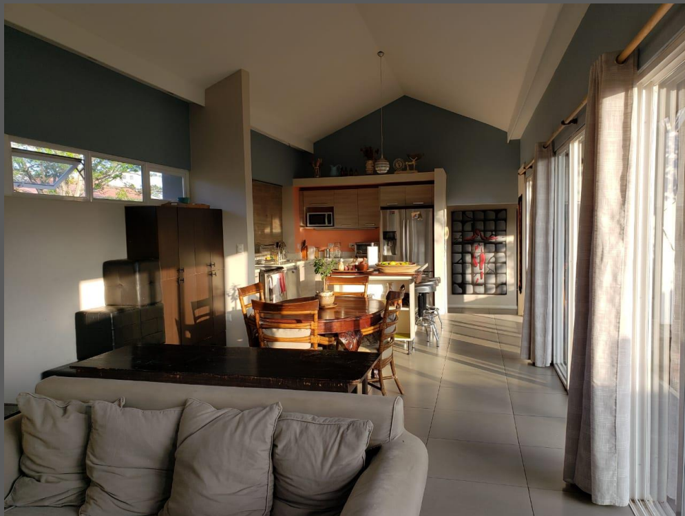
AREA SOCIAL / "FAMILY ROOM"