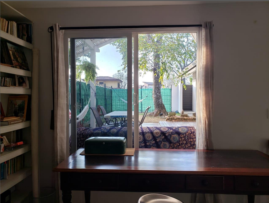
ESTUDIO / TV