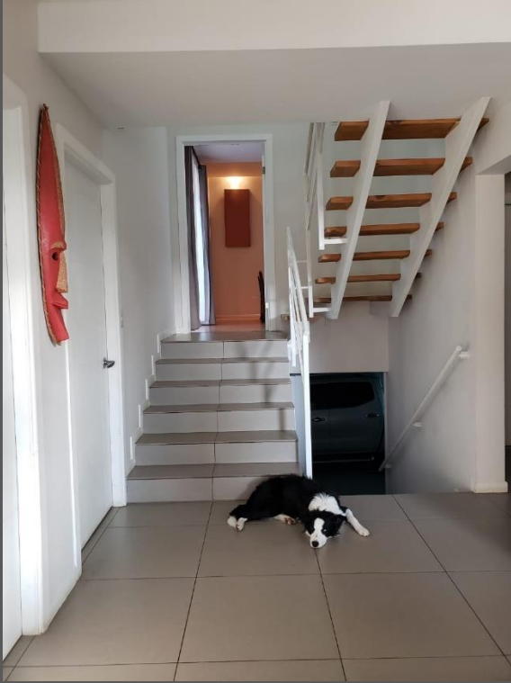
VESTÍBULO A DORMITORIOS