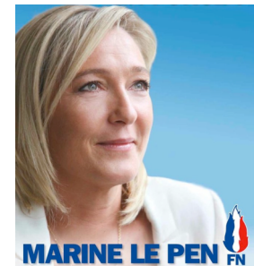
La leader du parti extrémiste et nationaliste dit « Front national »

La méfiance envers les gouvernements se traduit par un taux d'abstention de vote très élevé. Autrement dit, énormément de personnes ne vont pas voter. Cette situation profite aux partis extrémistes qui récoltent de plus en plus de voix. En effet, la crise économique et sociale pousse les groupes de population peu instruits à adhérer à ces partis politiques qui maîtrisent l'art de la parole pour convaincre les foules et proposent des changements radicaux (et dangereux). Ces partis sont très actifs, donc récoltent de plus en plus de voix. La population est également influencée par les médias*, qui font monter la peur qui favorise les comportements de repli sur soi.