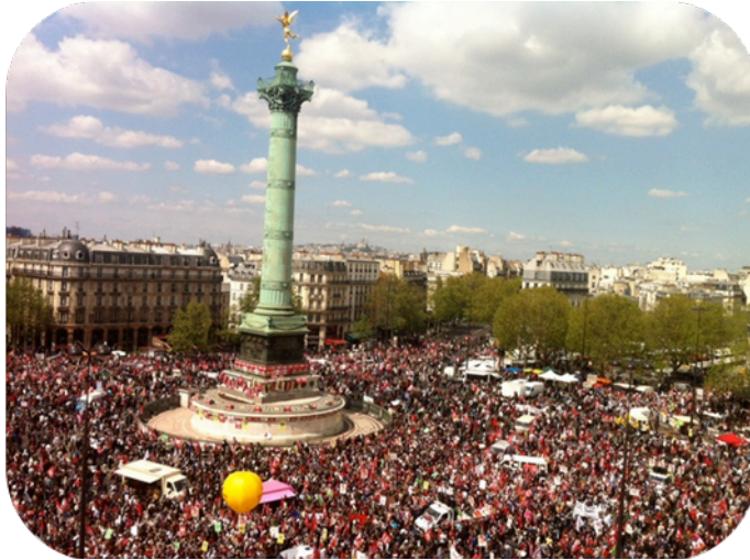
Un rassemblement des indignés, Place de la Bastille à Paris le 5 mai 2013

La crise économique dans laquelle l'Europe est plongée demande aux gouvernements et donc aux populations, à travers les impôts, les licenciements et autres mesures, de faire des sacrifices. Les inégalités se