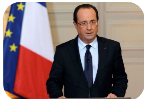
François Hollande, le Président de la République française

Un Président socialiste, François Hollande, a été élu, mais il est très peu apprécié par les Français tout comme son prédécesseur Nicolas Sarkozy. En effet, le gouvernement prend des décisions de manière peu démocratique et souvent contraires aux promesses qui avaient été faites dans le programme électoral. De nombreux scandales ont été dévoilés, comme lors de l'Affaire Cahuzac (on a découvert que le ministre du Budget, Jérôme Cahuzac, possédait des comptes bancaires en Suisse et à Singapour). La confiance dans la politique est donc réduite et la population, divisée, est lassée.