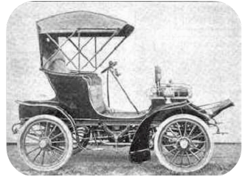
La toute première voiture qui a existé, elle est appelée « Le chariot à feu »

*métro : la première ligne de métro à Paris a été mise en place en 1900. Face au succès rencontré, 14 lignes sont ensuite construites