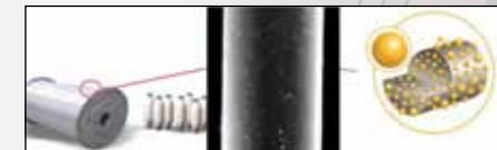
Procédé - Process: Nurel - Novarel