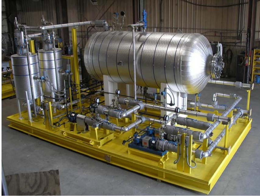
Sistema de almacenamiento de agua caliente para plataforma habitacional HA-QH ZAAP-C de PEMEX División Exploración Producción incluyendo bombas centrífugas fabricadas de acuerdo con el código API-610 marca David Brown Union Pumps Company modelo HHS-X ( 2006 )