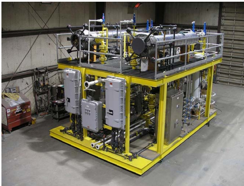
Paquete para acondicionamiento de gas combustible para plataforma de producción PB-KU-S de PEMEX División Exploración Producción ( 2005 )