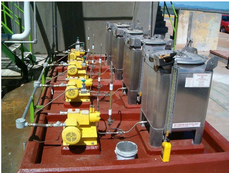
Sistemas de dosificación de inhibidor de corrosión para torres de enfriamiento para planta de inyección de amoniaco de Petróleos Mexicanos División Refinación incluyendo bombas dosificadoras marca Milton Roy serie MilRoyal fabricadas de acuerdo al código API-675 Topolobampo, Sinaloa ( 2004 )