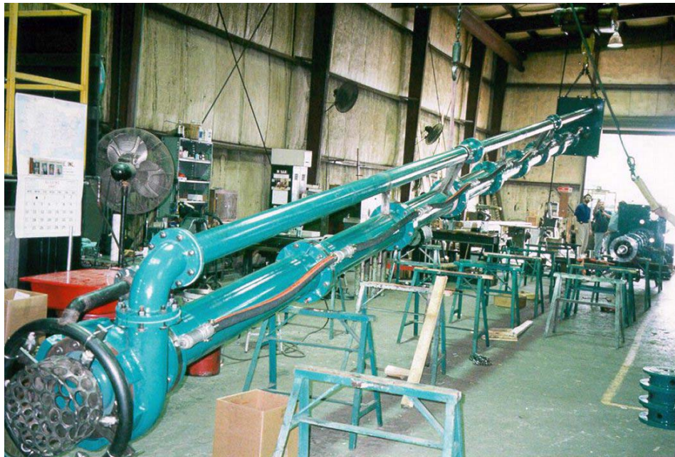
Bomba centrífuga vertical marca Nagle Pumps para bombeo de agua clarificada modelo CWSR-143 suministrada a Refinería Cadereyta N.L. PEMEX Refinación ( 1996 )