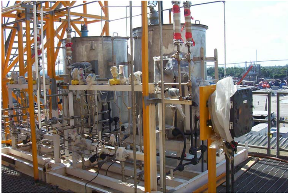
Sistemas de dosificación de antiespumante y anticrustante para la plataforma de producción KU-C de Petróleos Mexicanos División Exploración y Producción incluyendo bombas dosificadoras de accionamiento neumático marca Williams Milton Roy serie V fabricadas de acuerdo al código API-675 ( 2004 )