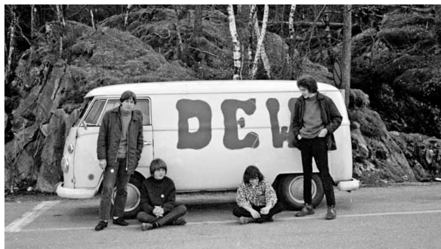
Dew her foran den tidstypiske folkevognbussen.