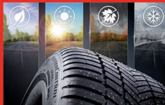
BANDEN & OPSLAG