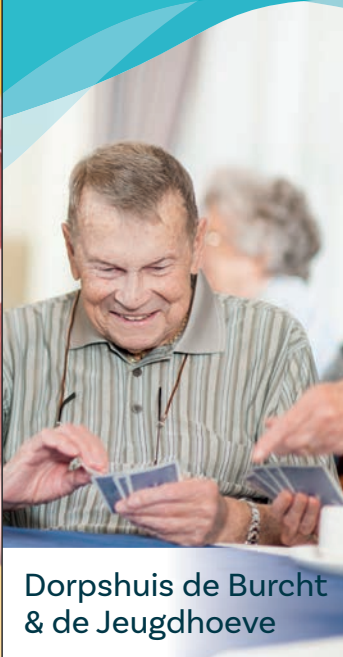
Dorpshuis de Burcht & de Jeugdhoeve