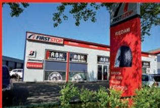
APK & ONDERHOUD