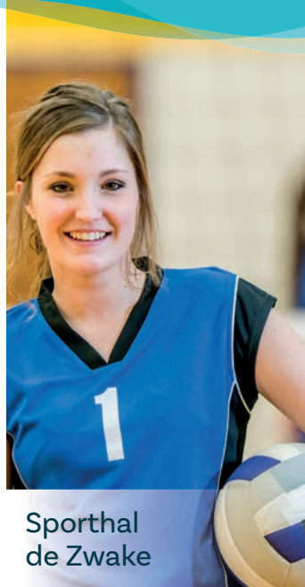
Sporthal de Zwake