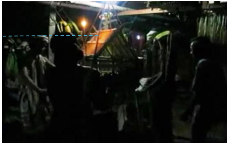
Menurunkan balai pengasuh kira-kira 1 Meter dari atap

Setelah selesai, Balai Kurung Resio diturunkan dan seluruh peserta upacara disuruh duduk di bawah Balai Kurung Resio sambil ditutup