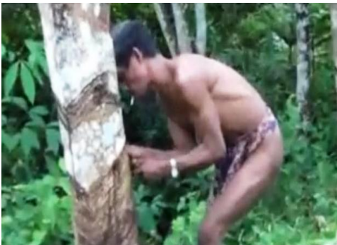
Suku Anak Dalam menyadap pohon karet untuk diambil getahnya

Kegiatan lainnya yang ada kaitannya dengan pemenuhan kebutuhan hidup adalah menangkap berbagai jenis ikan, termasuk udang dan ketam di sungai, dengan peralatan: pancing, jala, tombak, perangkap ikan (kubu-kubu), dan pagar-pegar ikan. Terkadang mereka nubo , yaitu menggunakan racun dari akar-akar Tabo . Caranya akar-akar tersebut dimasukkan ke sungai, maka ikan akan mabuk dan terapung. Dengan demikian, tinggal mengambil dan memasukkannya ke sebuah wadah yang disebut dukung atau ambung .