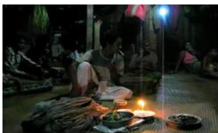
1. Suasana adat Besale

Setelah semua peralatan siap, maka proses pengobatan dimulai. Pertama-tama dukun Besale makan sirih, kemudian merapikan rambut dengan cara memberinya minyak dan menyisirnya secara rapi, dengan tujuan untuk menyucikan diri. Sejenak kemudian, dukun Besale mengambil duduk bersila untuk bersemedi dan memusatkan pikiran. Dalam semedi ini (dengan dibantu inang ), roh sidi akan masuk ke raga dukun Besale . Saat roh sidi masuk ke raga sang dukun, maka seketika itu juga dukun disebut sidi .