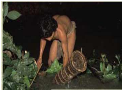
Menangkap ikan merupakan salah satu cara Suku Anak Dalam untuk memenuhi kebutuhan hidupnya