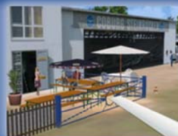
Aerosoft Online German Airports 9 Euro 27,95