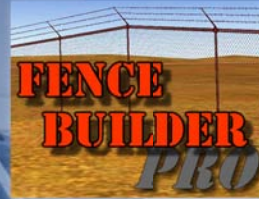
FenceBuilder Pro Euro 20,17