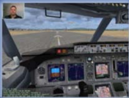
FS Flight Keeper 3.0 Euro 34,95