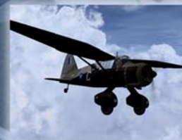
Lysander Secret Operations Euro 29,69