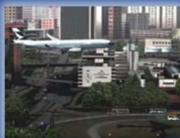
FlyTampa Hong Kong Kai-Tak Euro 27,-