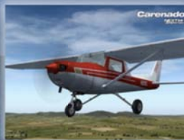
Carenado Cessna 152 Euro 19,60