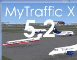
MyTraffic X 5.2b Pro Euro 39,27