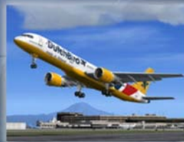
Captain Sim 757-200 Captain Pro Pack Euro 54,99