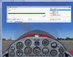
SZ Flight Data Recorder Euro 19,99