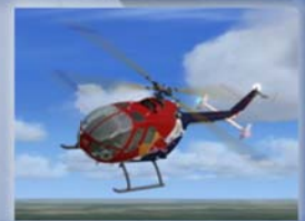
Nemeth Design BO-105 Euro 25,89