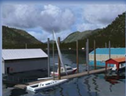
FSAddon Tongass Fjords X Euro 33,26