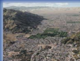
FS Dreamscapes ProMesh California Euro 26,95